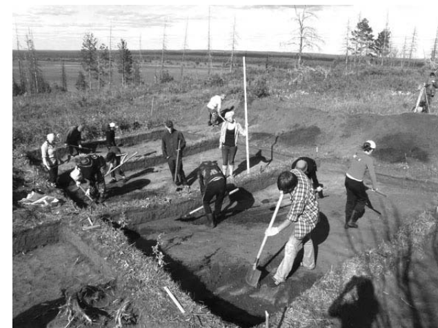
Раскопки С.А. Перевозчиковой, 2010 г.

Дизайн: С.А. Перевозчикова Макет: В.Г. Базанова Ижевск, 2013