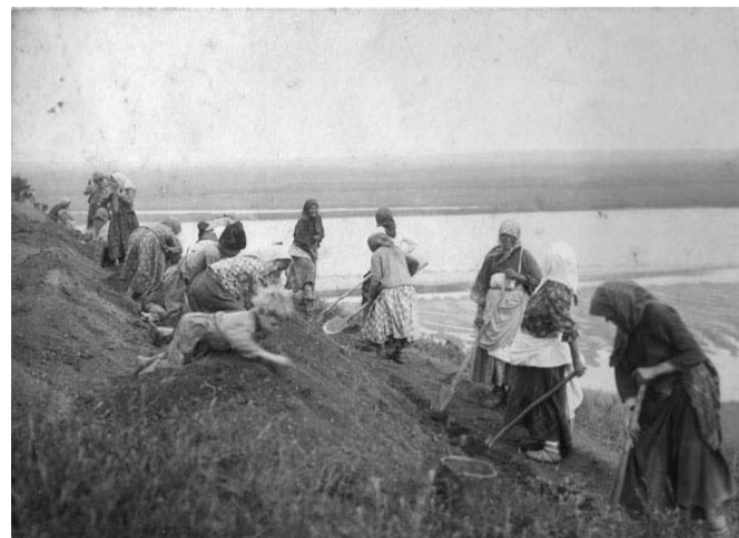
Раскопки Л.А. Беркутова, 1913 г.