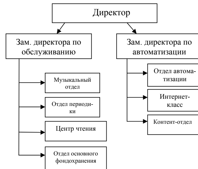
Рисунок 2. Организационная структура библиотеки (пример)