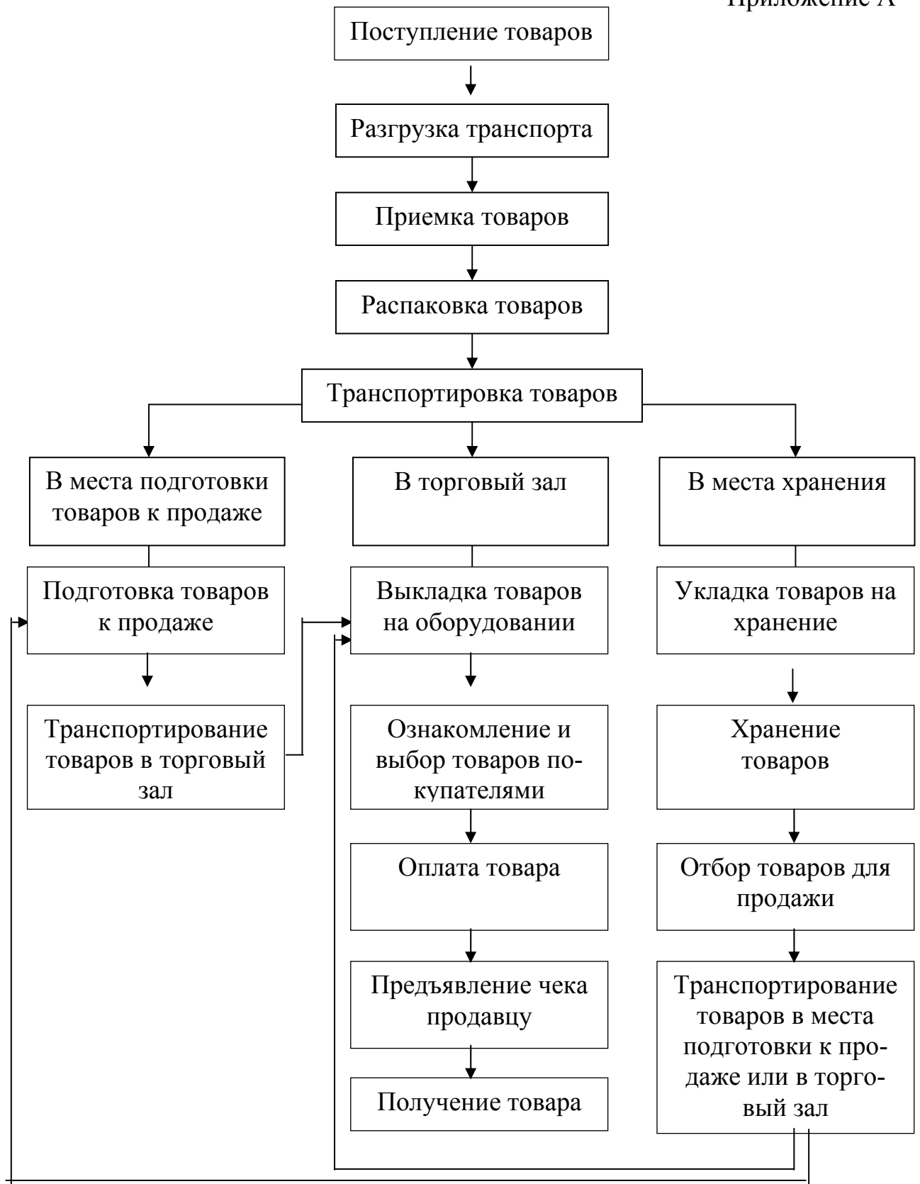
Рисунок – Схема ТТП