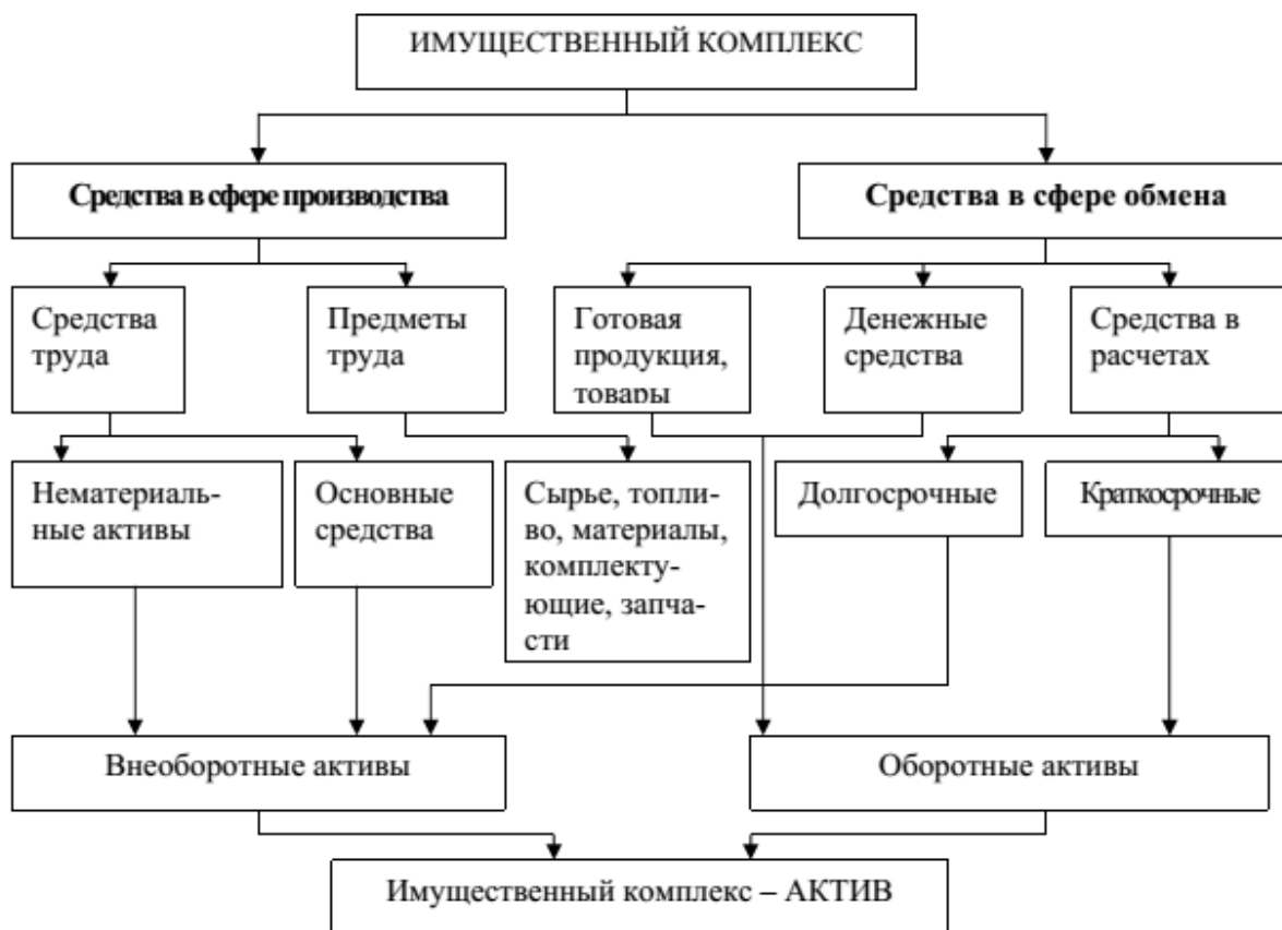
Рис. 1. Состав и структура имущества предприятия

Задача 1.1. Сгруппируйте хозяйственные средства машиностроительного завода по видам и составу в табл. 2. по данным на 1 января 20__г., приведенным в табл. 1.