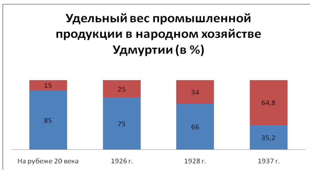
Рис. 1. Удельный вес промышленной продукции в народном хозяйстве Удмуртии (в %)

Составлено по книгам «Очерки истории Удмуртской организации КПСС», Ижевск, 1968 г., с.16; «Очерки истории Удмуртской АССР» т.2 Ижевск, 1962 г., с.142; «История индустриализации Нижегородского Горьковского края» Горький, 1968 г., с.310.