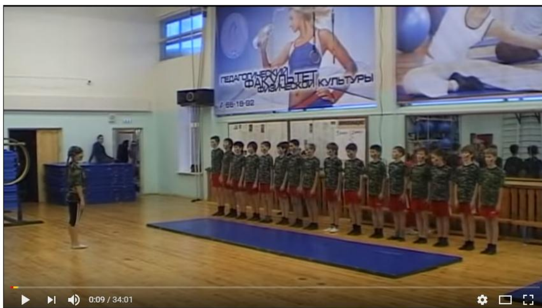
Рисунок 2 - Ссылка на сюжетный урок по гимнастике в школе

Важное значение при создании и реализации дистанционного курса имеют ссылки на различные документы, такие как ФГОС для учащихся общеобразовательных школ, комплексная программа по физическому воспитанию, образцы конспектов занятий и технологических карт, документов планирования. Большое значение приобретают ссылки и просмотр уроков гимнастики с использованием различных средств и методов обучения, а также массовые соревнования по гимнастике в школе. На большие по объему видео делаются ссылки на Ю-тюб, куда предварительно размещаются отснятые на кафедре видеоматериалы (рис.2).