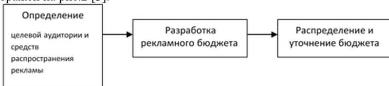
Рис.2 Этапы формирования рекламного бюджета исходя из метода оптимизации

В связи с растущим интересом применения оптимизационного метода планирования рекламных расходов возникает необходимость изменения последовательности формирования рекламного бюджета. Предлагаемый подход изображен на рис.2 [3].