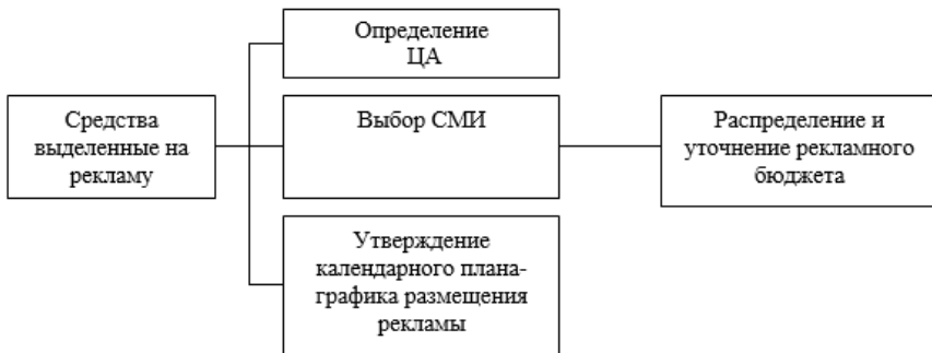
Рис.1 Этапы формирования рекламного бюджета исходя из выделенных средств.

Утвердившаяся в теории и на практике разработка рекламного бюджета проходит этапы, показанные на рис.1.