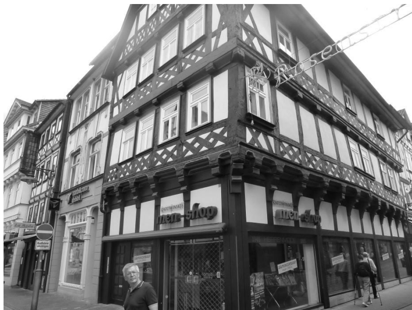
Геттинген. Фахверковые дома.

мом)... А обедали там, где тусуются местные – средняя цена второго блюда – 12-15 евро, порции просто огромные.