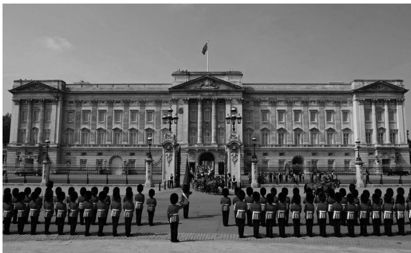
Лондон. Букингемский дворец.

Сандро Боттичелли, Леонардо до Винчи, Микеланджело, Тициана, Иеронима Босха, Питера Брейгеля Старшего и т.д. В галерее экспонируются картины Рубенса, Рембрандта, а из английских мастеров выделяется Томас Гейнсборо. Для меня лично очень значимым стало знакомство с «Подсолнухами» Винсента Ван Гога. Этому шедевру отдан отдельный зал, который никогда не пустует. Здесь встречаются родственные души, которых когда-то очаровал Ван Гог, и это уже навсегда.