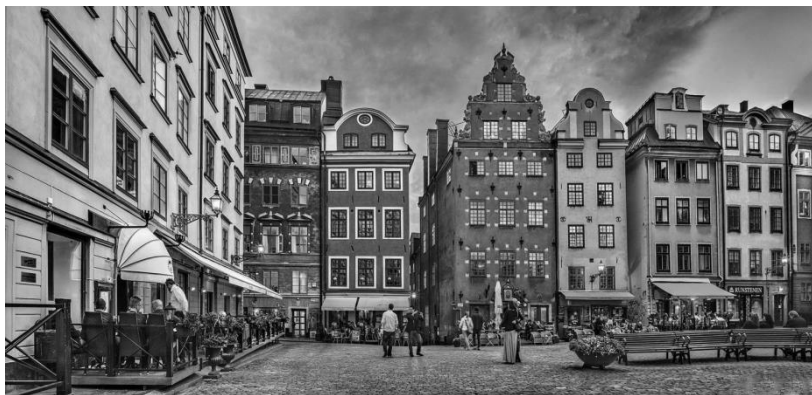
Стокгольм. Ратушная площадь.

Официально столицей Швеции Стокгольм стал в 1634 г., но фактически он был главным городом в стране уже в первой половине XV в. Это был крупнейший торговый центр на севере Европы. Шведские короли жаловали Стокгольм различными торговыми привилегиями, так как были заинтересованы в получении доходов с этой торговли. Неудивительно, что самым великолепным зданием шведской столицы является королевский дворец. Но, честно говоря, там все время взгляд устремлен вверх в надежде увидеть Карлсона, который живет на крыше.