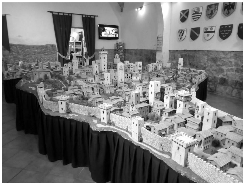
Сан-Джиминиано. Макет средневекового города.

Главной проблемой средневекового города был дефицит питьевой воды, поэтому в итальянских городах на самом почетном месте всегда колодцы. Жители доверили найти источник какому-то лозоходцу, который с веточкой обошел все окрестности. Он указывал на разные места, но ничего не получалось. Городской совет постановил казнить его на площади и разрешил перед смертью исполнить последнее желание бедняги. Тот указал: «Копайте прямо здесь!» И, о чудо, - появилась вода и построили колодец.