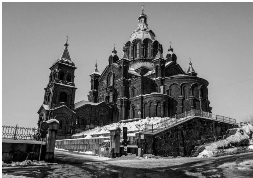
Хельсинки. Успенский кафедральный собор.

На Можжевеловом холме над портом расположился Успенский кафедральный собор, построенный в неорусском стиле в 1862–1868 гг. Его автор – архитектор Алексей Максимович Горностаев. Множество реликвий в соборе, в том числе иконы великомученицы Варвары и святителя Николая Чудотворца. Он считается самым большим православным собором Западной Европы и это действующий приход, службы осуществляются на финском языке. Русские в Финляндии – третья по величине этническая община после финнов и шведов, то есть примерно 1% населения страны. Туристам показывают район на заливе, где располагались дачи русской дореволюционной аристократии, например семейства Бенкендорфов и остальной свиты Николая I.