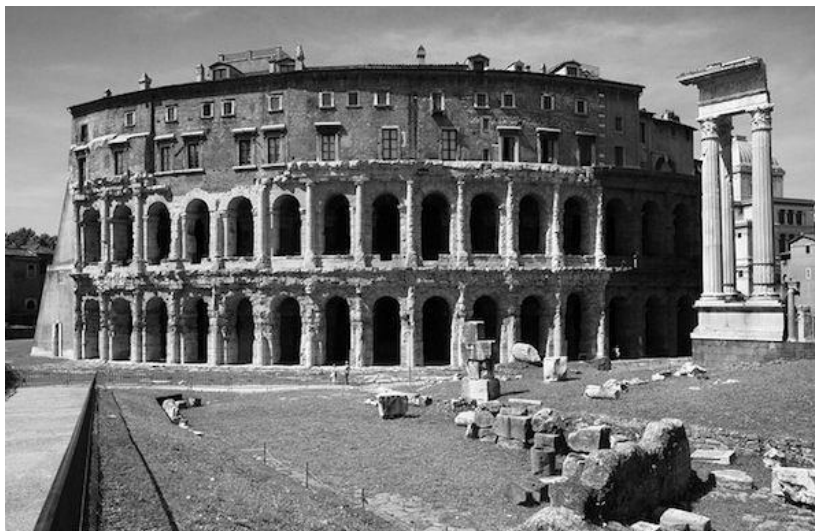
Рим. Театр Марцелла.

мент стены, но чтобы она не разваливалась, в нее встроили дом. Представляете, как это жить в античном театре? Вот и я до этого дня не имела понятия.