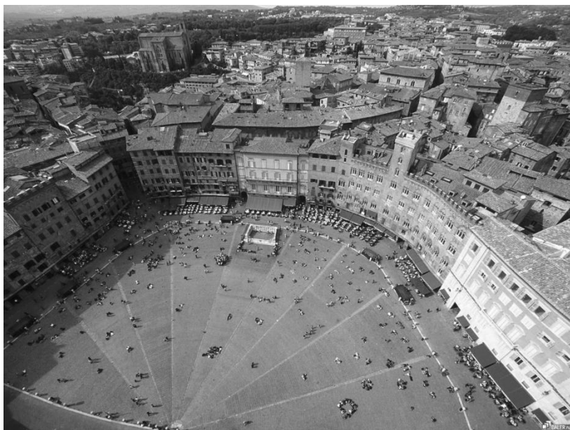
Сиена. Ратушная площадь.

кафе и ресторанах заняты, башня сияет и как будто приветствует. Даже овчарка на балконе по-прежнему лениво облаивает прохожих. Туристы бродят по-летнему дресс-коду, итальянцы очень хорошо одеты. Особенно пожилые, все выползли на солнышко погреться. Солнце прекрасное, розы цветут, бабочки летают, птицы поют в октябре месяце. Все брендовые витрины на своих местах, только вот музыкальный магазин в центре закрылся, уступив место дорогому бутику. Сын его владельца помогал мне в прошлый раз с переводом лекции с русского на итальянский. В общем, Сиена как была, так и остается благопристойной, туристической и чуть-чуть обывательской.