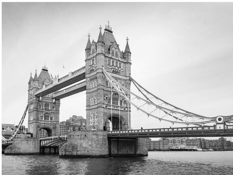
Лондон. Тауэрский мост.

Большой Бен, он прямо как на картинках, нисколько не разочаровал, дружелюбно отбил какое-то время своими курантами. От него мы отправились в круиз по Темзе до лондонского Тауэра. Темза река полноводная, широкая, по ней движется масса туристических судов. Проплавали под мостом Миллениум, построенном к рубежу двух тысячелетий в 2000 г., где-то на горизонте показался бизнес-центр Лондона и собор святого Павла. Прямо напротив Тауэра на вечном приколе стоит эсминец времен Второй Мировой войны, прямо как крейсер «Аврора» в Питере.