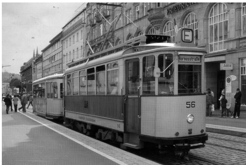
Фрайбург. Городской трамвай.

В городе потрясающие мощные цветным гранитом с узорами улицы, специальные канавки для стекающей с гор воды, допотопные трамваи и место у фонтана, где сходятся все трамвайные линии. Проявила слабость – на трамваях надолго накаталась, да и город заодно изучила. Выяснилось, что во Фрайбурге еще, как минимум, педагогический университет и высшая школа философии имени Макса Вебера. У них огромные территории, множество корпусов. А еще клиники, клиники, клиники... Прием частных врачей-специалистов на каждом углу практически. Видимо тут все учатся, а многие лечатся.