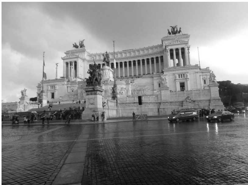
Рим. Алтарь Отечества.

Где-то на полдороги от цирка к площади Венеции «живут» знаменитые «Уста Истины», про которые подробно рассказали, но автобус не остановился.