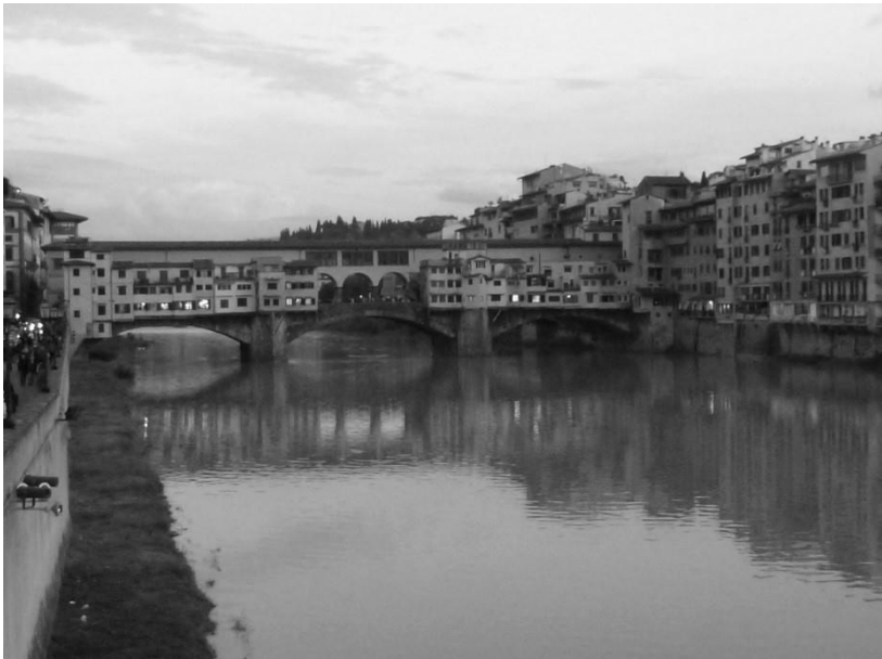
Флоренция. Золотой мост.

На площади Синьории играют уличные музыканты, звучат неаполитанские мелодии, арии из знаменитых итальянских опер. Там же символ города – статуя Давида Микеланджело, правда это копия. Есть закрытый портик с подборкой скульптурных композиций, украшает его подлинник статуи Персея работы Челлини. У галереи Уффици кривляются очаровательные мимы, особенно хорошенький был Амур. Рядом с ним – сивилла, Тутанхамон и т.д. На улицах Флоренции развернуты ярмарки, продается как продукция местных фермеров, так и многое другое. По городу курсируют коляски, запряженные лошадьми. Туристов здесь значительно больше, несмотря на то, что на дворе – конец ноября. Город на каждом шагу демонстрирует свое великое прошлое, столько памятников историческим личностям есть разве что в Лондоне.