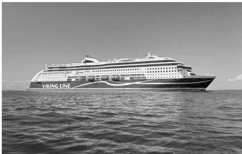
Паром Хельсинки – Стокгольм.

Сидеть в ней некогда, нас ждали приключения. Корабль – это целый город с ресторанами, барами, магазинами, спортплощадками, танцполами, сауной, зоной игровых автоматов и прочая, прочая, прочая... Кто бы мог такое вообразить! В момент отхода из Хельсинки выбрались на самый верх, посмотреть на город с моря. Красота неопишная – подсветка, блики на воде, шум винтов корабля, свежий морской бриз... ПОЛНЫЙ ВПЕРЕД !!!