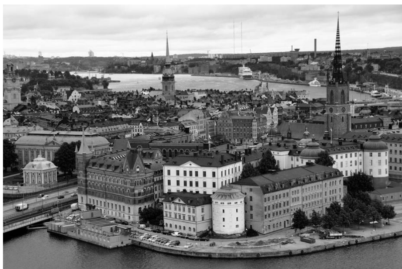
Стокгольм. Центр города.

Уже более 200 лет Швеция не знает, что такое война. Судьба была милостива к этой стране: когда послевоенная Европа залечивала свои раны, в Швеции оберегали права человека, заботились об охране труда и неустанно следили за тем, чтобы у всех были равные возможности. Здесь не рвались бомбы, ни один камень не упал с ее стен, поэтому нетронутой осталась красота древнего Стокгольма.