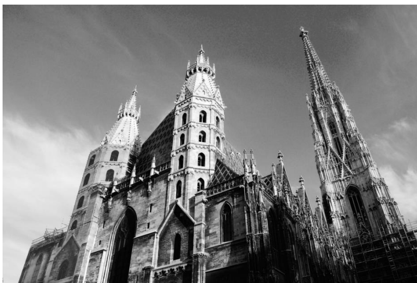
Вена. Собор св. Стефана.

метровая башня давно стала символом Вены. Из капеллы северной башни можно спуститься в катакомбы, разветвленную сеть туннелей и комнат, которая служила склепом. Когда места на кладбище Штефанплац стало не хватать, Иосиф II запретил такой способ похорон и приказал в 1872 г. очистить и замуровать катакомбы. В настоящее время доступна только герцогская усыпальница, с XVII в. здесь в медных урнах хранятся внутренности всех Габсбургов. Вена вообще полна мистических тайн, на ум сразу приходит история с захоронением Моцарта. Да и не она одна.