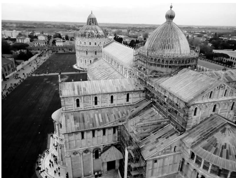
Пиза. Поле чудес.

Поле чудес, на итальянском «Пьяцца деи Мираколи» – именно так называется туристическая цель путешествия всех паломников к падающей башне. Она является составной частью большого архитектурного ансамбля XII в.: собор, баптистерий, музеи. В 1155 г. площадь чудес была окружена стенами, а вскоре поблизости появилось городское кладбище и новая лечебница. Здесь хоронили знаменитых горожан, примечательно, что землю доставили крестоносцы с горы Голгофа.