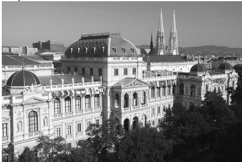
Вена. Главное здание университета.

Остальные кафедры и институты рассредоточены более чем в 60 пунктах в Вене.