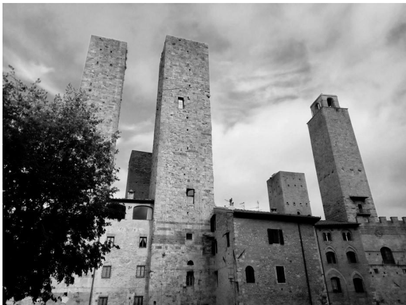
Сан-Джиминиано. Город башен.

евро к стенам старого города. По дороге пейзажи за окном изменились несколько раз – сначала был городок со смешным названием Поджибонси, где в автобус ввалилась целая стая беззаботной итальянской молодежи, он показался после Сиены маленькой Можгой. В полях (в буквальном смысле этого слова) встречались четырехзвездочные отели, видимо, для любителей агротуризма. Маршрут проходил мимо торговых центров, производственных павильонов, заметна специализация региона на торговле мебелью.