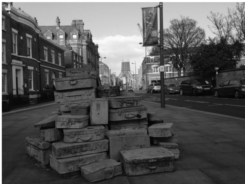
Ливерпуль. Памятник чемодану.

Гуляли и по городу, заходили в местный англиканский собор. Он является главной религиозной достопримечательностью города. Собор был заложен в 1904 г. и построен в неоготическом стиле, а освящен в 1924 г. Ливерпульский собор – один из самых больших соборов в мире, колокольня и орган тоже своего рода рекордсмены. Собор построен на окраине Чайнатауна, который в свою очередь считается одной из достопримечательностей города. Но почему-то больше всего запомнилась уличная скульптурная группа в виде горки чемоданов, на которую можно присесть.