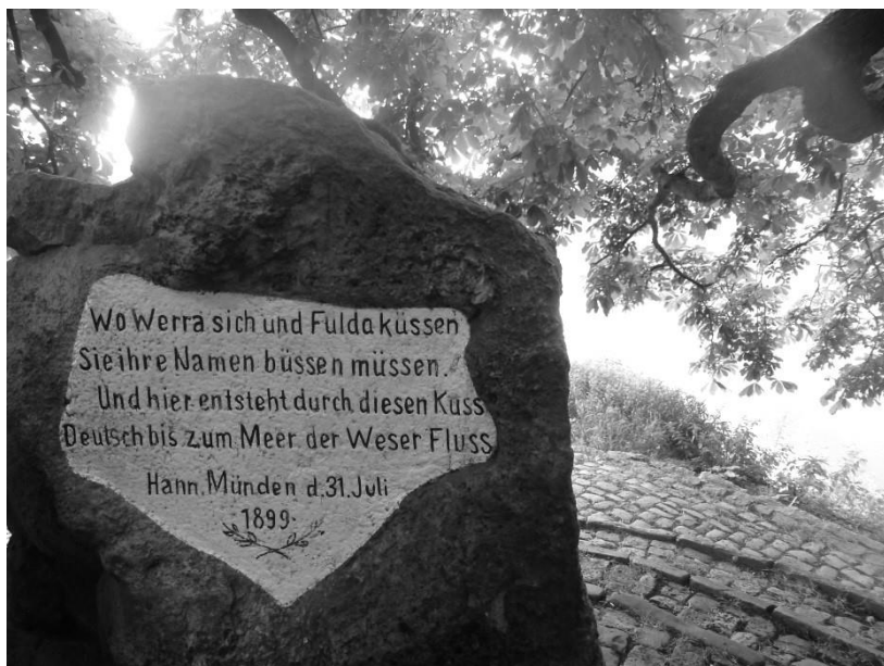
Ханн-Мюнден. Слияние двух рек.