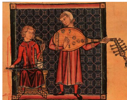
Рис.4. Средневековая миниатюра.