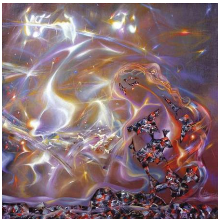
Рис.3. З.А.Маранов. Гармония