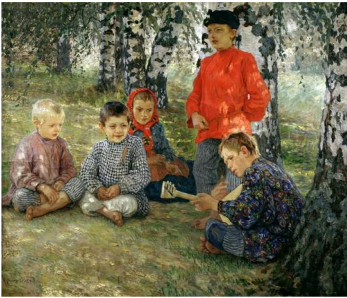
Рис.8. Н.Богданов-Бельский. Виртуоз