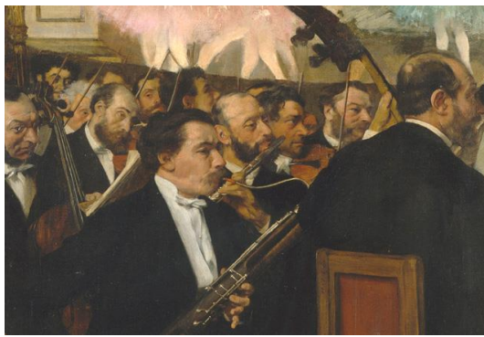
Рис.7. Э.Дега. Оркестранты оперы.