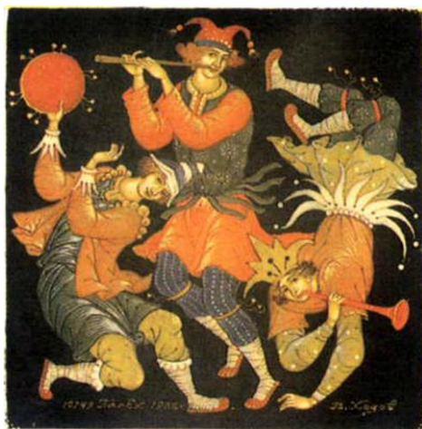
Рис.5. В.Ходов. Музыканты