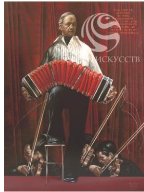
Рис.9 П.Дольский. Астор Пьяццолла