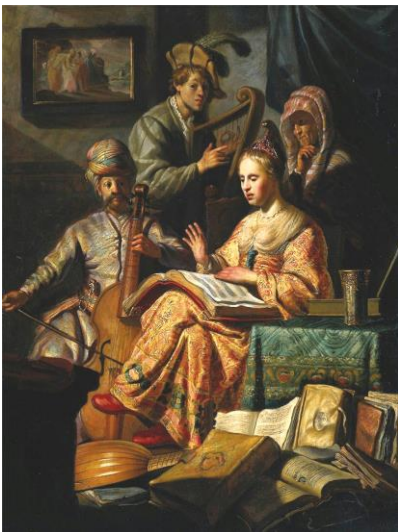
Рис.10.Рембрандт. Музицирующее общество.