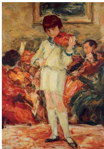
Рис.2 Л.Пастернак. Мальчик со скрипкой.