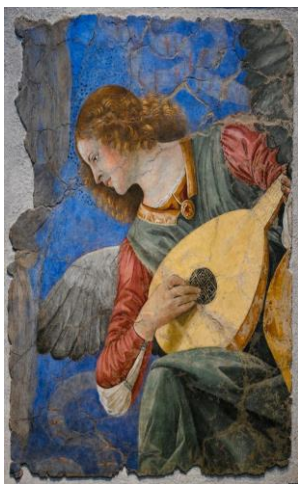
Рис.1. Мелоццо да Форли. Ангелы.

Таким образом, через жест, колорит, композицию художник стремится и преуспевает в передаче впечатления от музыкального произведения языком живописи.