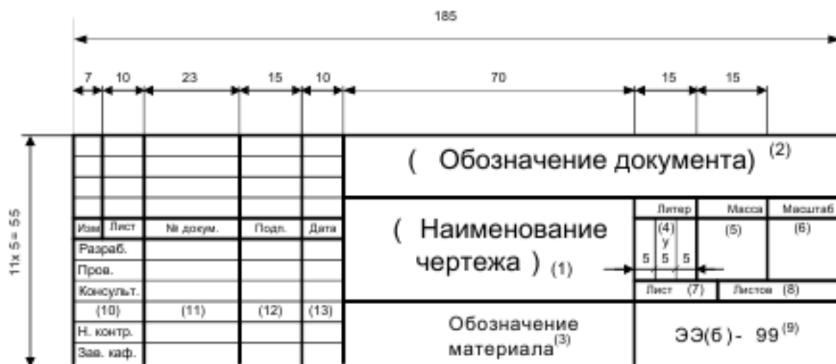
Рис. 3.1. Основная надпись (штамп)

в графе 1 – наименование чертежа в именительном падеже единственного числа.