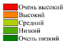
Рис. 1. Эпидемиологический потенциал туберкулёза.