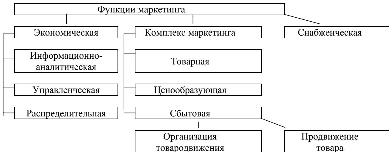
Схема 3. Основные функции маркетинга коллективной сельскохозяйственной организации

Служба маркетинга может функционировать в организационно - экономическом механизме сельскохозяйственной организации и как самостоятельное производственное подразделение, и как составная часть каждого из производственных подразделений организации, подчиняясь единому руководству.