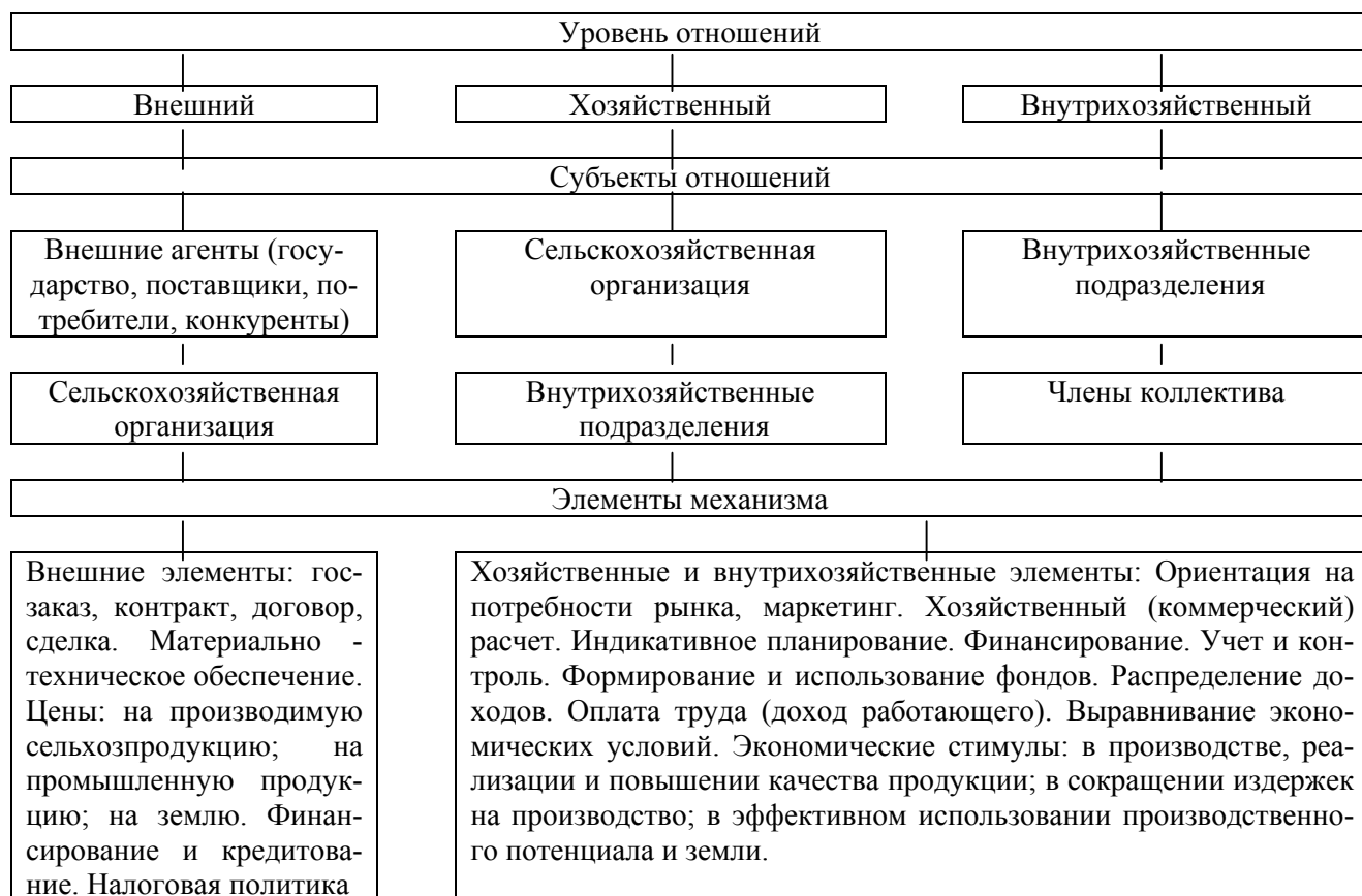
Схема 2. Экономический механизм хозяйствования сельскохозяйственной организации

Будучи составной частью организационно-экономического механизма, экономические отношения формируются в собственную структуру, действующую, по нашему мнению, на трех уровнях (схема 2), каждый из которых регулируется своими элементами.