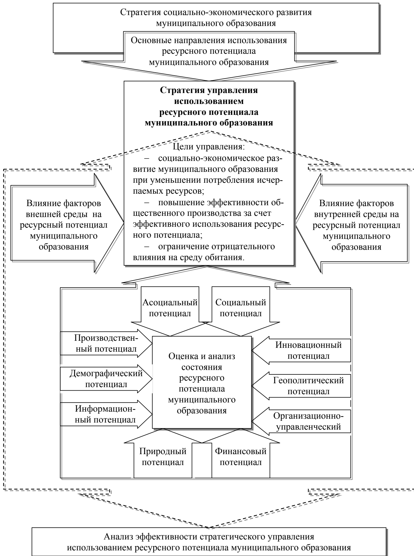
Рис. 2. Организационно-экономическая модель стратегического управления использованием ресурсного потенциала муниципального образования