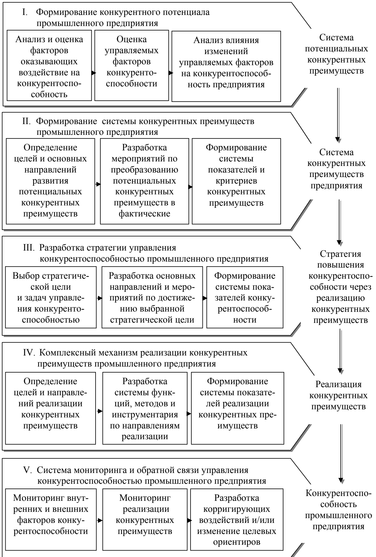
Рисунок 4 – Организационно-экономическая модель управления конкурентоспособностью промышленного предприятия