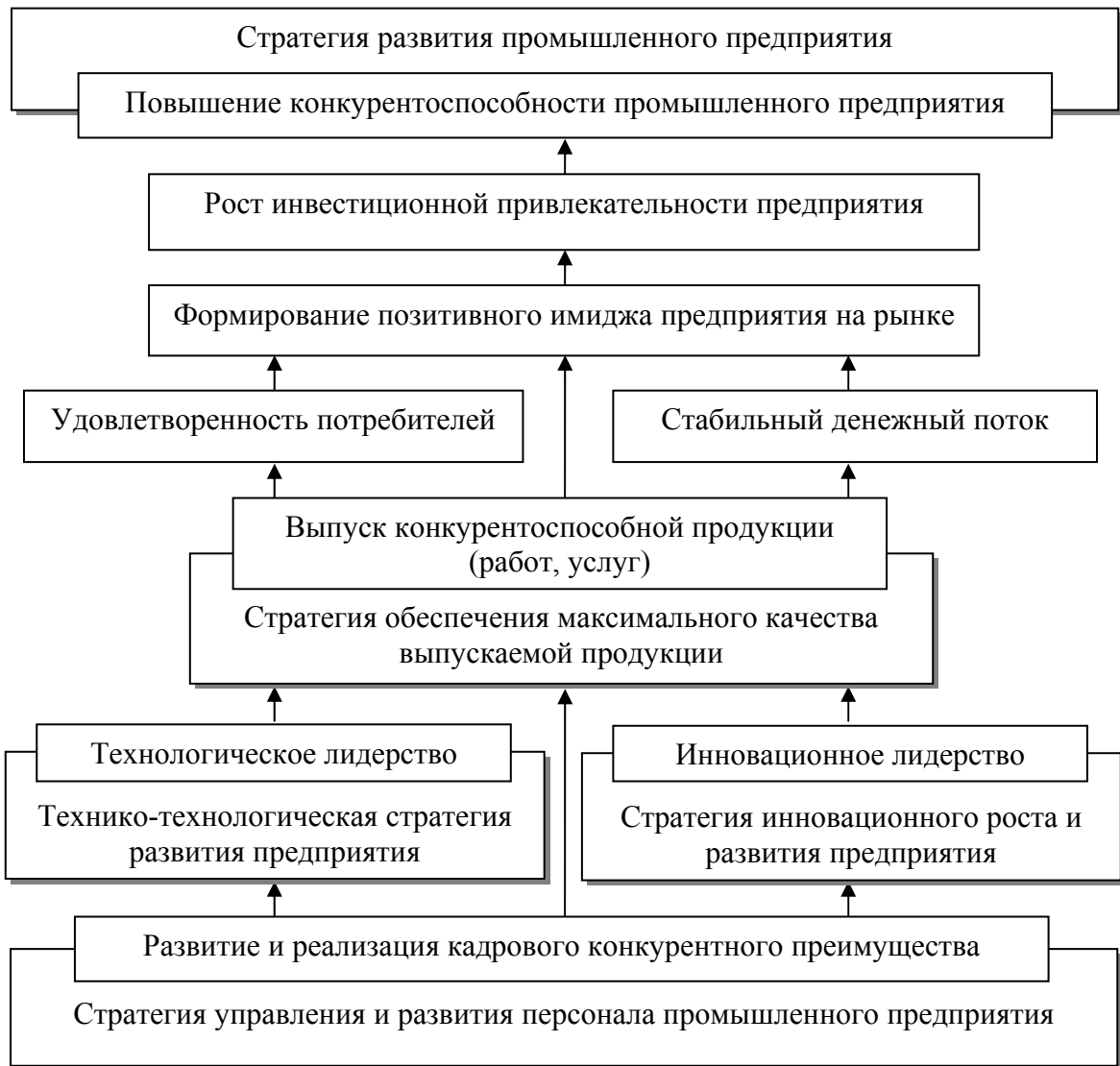
Рисунок 3 – Влияние реализации конкурентных преимуществ на конкурентоспособность промышленного предприятия

Развитие и реализация конкурентных преимуществ является наиболее действенным и перспективным инструментом управления конкурентоспособностью промышленного предприятия в условиях обострения конкурентной борьбы.