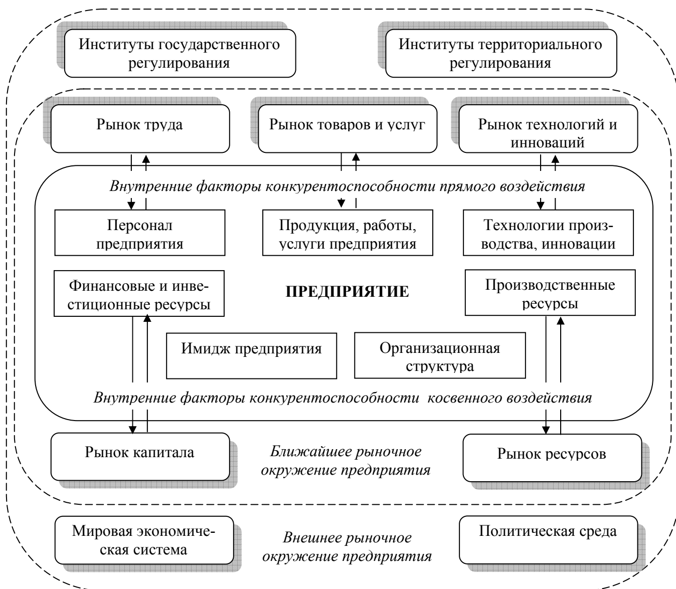
Рисунок 1 – Рыночное окружение и факторы конкурентоспособности предприятия

В процессе функционирования предприятия, конкурентные преимущества находятся между собой в тесном взаимодействии и являются основными факторами конкурентоспособности, они создаются, реализуются и наращиваются в процессе взаимодействия предприятия с различными субъектами рыночного окружения. Наиболее значимыми конкурентными преимуществами, одновременно представляющими собой внутренние факторы конкурентоспособности и определяющими специфические условия функционирования предприятия, в современных условиях являются: выпускаемая продукция, работы, услуги; используемые технологии; инновации; персонал предприятия (рис.1).