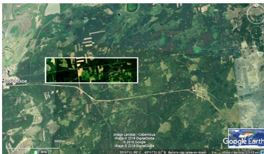
Рис. 2. Расположение экотропы в границах Белозерского заказника.