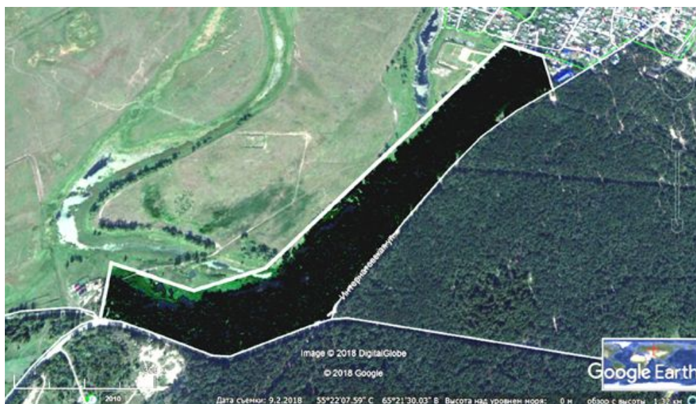
Рис. 3. Расположение ООПТ «Зауральский лес». Основа: Google Earth Pro Image © [5]

Характерное для долины Тобола взаимопроникновение флористических элементов определяет богатство флоры ООПТ как бореальными видами, приуроченными к северной и северо-западной экспозиции берегового склона (такими как Lilium pilosiusculum , Primula macrocalyx Bunge, Cypripedium calceolus , Dryopteris carthusiana (Vill.) H.P.Fuchs, Botrychium lunaria (L.) Sw.), так и степными, встречающимися на открытых, хорошо прогреваемых участках ( Stipa pennata L., Festuca pseudovina Hack. ex Wiesb., Thymus marschallianus Willd.).