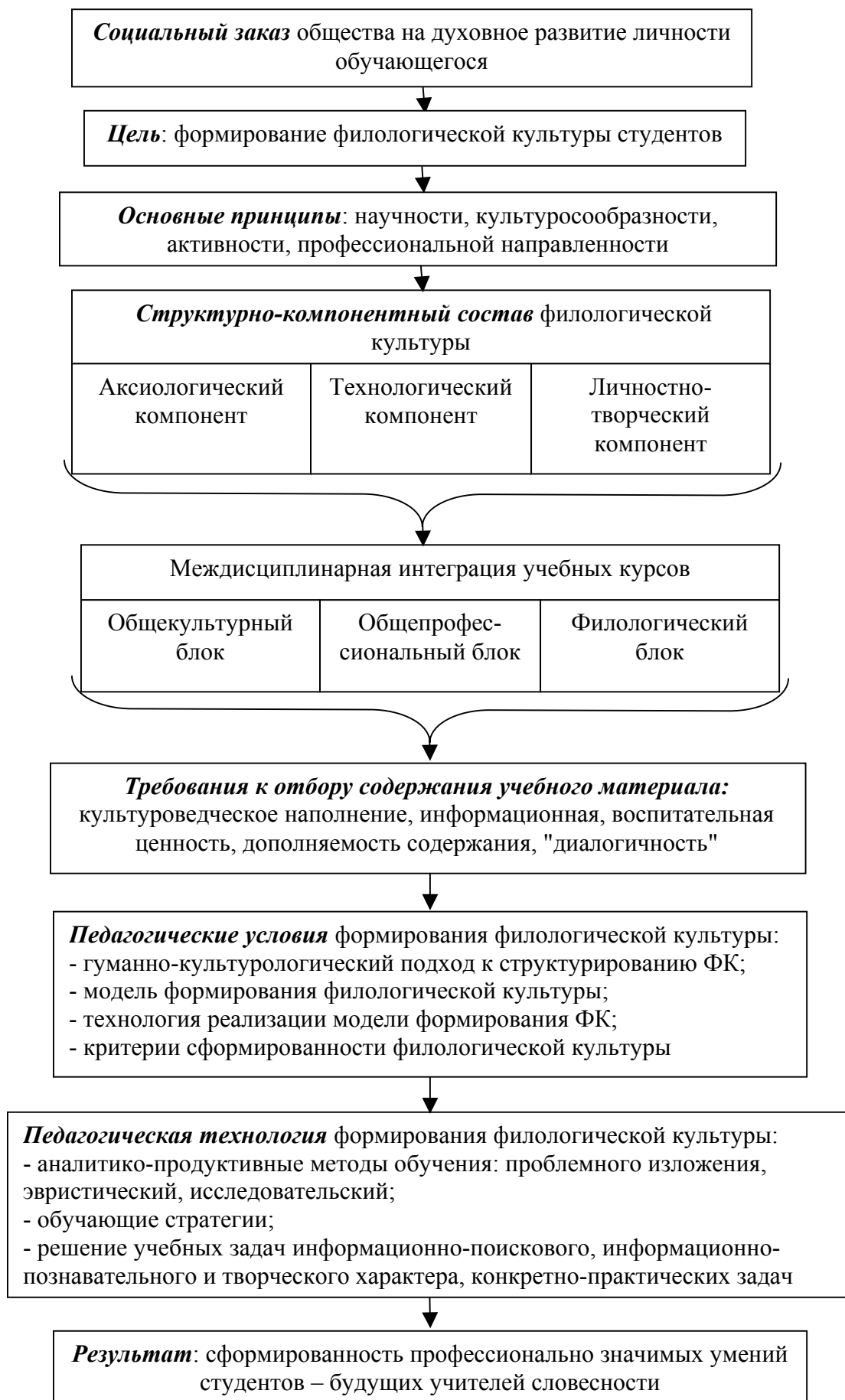
Схема 2. Модель формирования филологической культуры студентов