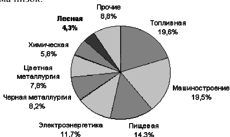
Рис. 2. Структура российского промышленного производства по отраслям промышленности в 2002 г., %

Несмотря на перспективы быстрого роста российского ЛПК отрасль продолжает находиться в состоянии, близком к стагнации. В 2002 году предприятиями лесной промышленности произведено продукции на сумму около 295млрд.руб. (9,4млрд.долл.), что эквивалентно выручке всего лишь одной компании, занимающей 9-10 позицию в рейтинге 100 крупнейших мировых лесопромышленных корпораций, составленном Pricewaterhouse Coopers. Доля отрасли в общем объеме промышленного производства составила 4,3% (рис. 2). По сравнению со странами, обладающими развитым лесным комплексом, этот показатель весьма низок.