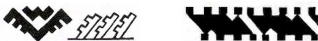
Мотив «Чож» — утка и «чож бурд» «Вало-вало» — кони, утиные крылья (Виноградов 1973)