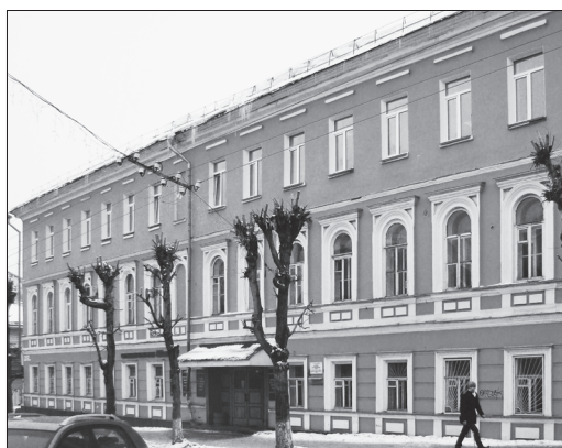
Дом К. Р. Мойке в Вятке. Фото М. В. Курочкина, 2019