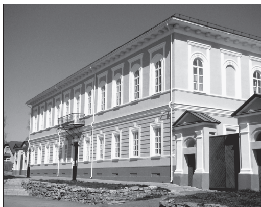
Дом причта Спасского собора в Елабуге. Фото М. В. Курочкина, 2017