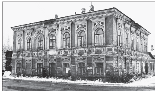
Дом М. Н. Мошкина в Сарапуле. Фото М. В. Курочкина, 2019

В Сарапуле в 1868 г. Михаил Николаевич Мошкин на Большой Покровской улице возводит городскую усадьбу [9]. Городская усадьба Мошкина (Сарапул, улица Интернациональная, дом 3) расположена на пересечении улиц Труда и Интернациональной. Интересный пример гостевого дома периода эклектики с двумя сохранившимися зданиями служб – флигелем и кирпичным хозяйственным корпусом.