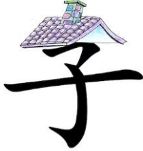
Рисунок 1 - Образец карточки-ребуса.

Подготовка к данной игре займет некоторое количество времени. Преподаватель готовит карточки-ребусы (рисунок 1), заменяя в иероглифах ключи на картинки. Перед началом игры ведущий раскладывает перевернутые карточки на столе. Учащиеся по очереди открывают ребусы и угадывают зашифрованный иероглиф, записывая полный вариант на доске. Можно играть на время или разделившись на команды.