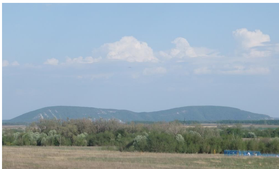
Рис. 1. Шихан Куштау (общий вид с западной стороны) Fig. 1. Shikhan Kushtau (general view from the western side)

Куштау – самый обширный по площади и наиболее облесенный шихан, имеет форму двугорбого хребта (рис. 1 и 2). Его протяженность с севера на юг 4 км, с запада на восток – 1–1.4 км. Со стороны западного и южного склонов его огибает р. Белая. Координаты южной вершины Куштау – 53.69^{\circ} с. ш., 56.08^{\circ} в. д.