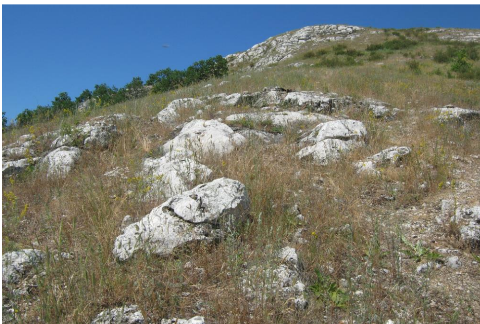
Рис. 4. Петрофитные степи южного склона Куштау Fig. 4. Stony steppes of the southern slope of Kushtau