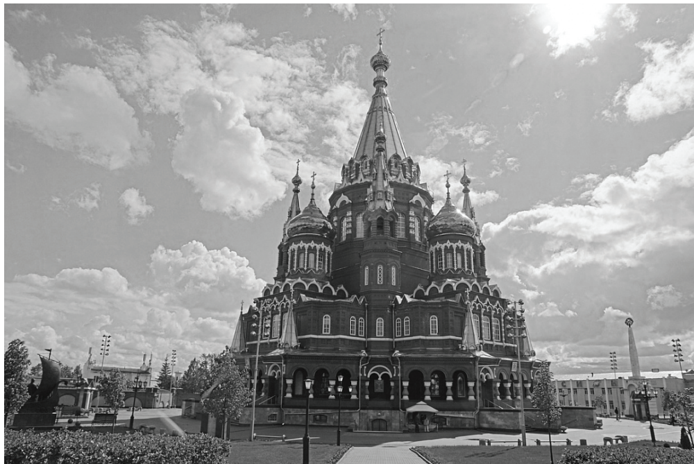
Фото 1. Свято-Михайловский собор, 2018 г.

туризма и развитие крупного бизнеса. Например, в Санкт-Петербурге после сноса старой застройки появляются коммерческие объекты, чаще всего торговые центры. Там, где сосредоточены признаваемые исторические и архитектурные ценности, бизнесу и власти особенно легко скооперироваться. Часто союзы основаны на неформальных связях, как дружеских, так и родственных. [10, с. 245]. В ситуациях противостояния вокруг сноса исторических построек власти находятся на стороне застройщиков. В контексте неолиберальных реформ местного управления происходит децентрализация политической ответственности [9, с. 30], выражающаяся в том, что в ходе развития городских пространств власти делают выбор в пользу ресурсных игроков иногда в ущерб интересам обычных граждан. Например, строительство ледяного городка "Сказбург" в период новогодних праздников 2017/2018 гг. в Ижевске стало примером противоречий между приватизацией общественного пространства с целью извлечения коммерческой прибыли и притязаниями на общедоступность [3, с. 464].