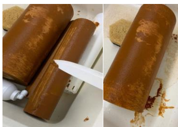
Рис. 1 Проточный фильтр в Октябрьском районе г. Ижевска

Несвоевременная замена картриджа приводит к тому, что все накопившиеся в нем продукты очистки станут вторичным источником загрязнения. В связи с неудовлетворительным техническим состоянием трубопроводных сетей происходит сброс неочищенных хозяйственно-бытовых сточных вод в поверхностные водные объекты, что ведет к их загрязнению.