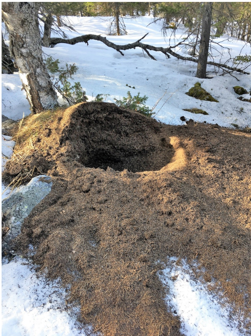
Рис. 4. Медведь вышел из берлоги и разорил муравейник. 2 мая 2019 г. Хребет Нургуш, Челябинская обл.