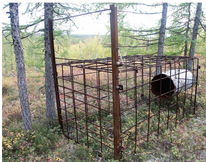
Рис. 3. Ловушка на медведя. 7 сентября 2007 г, ЯНАО, лесотундра.