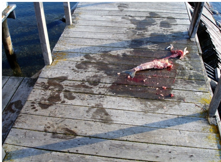
Рис. 2. Здесь медведь кормился красной рыбой. 13 августа 2007 г. Камчатка.