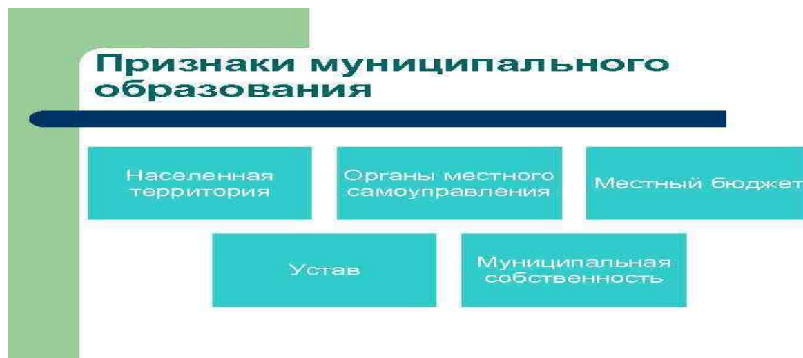
Рис. 2. Признаки муниципального образования

Как видно из таблицы 1, количество муниципальных районов, сельских и городских поселений уменьшается, а количество муниципальных округов увеличивается, что свидетельствует о нецелесообразности и неэффективности двухуровневой системы местного самоуправления, которая исчерпала свой ресурс. Сельскими поселениями фактически утерян статус муниципального образования – отсутствуют признаки муниципального образования [рисунок 2].