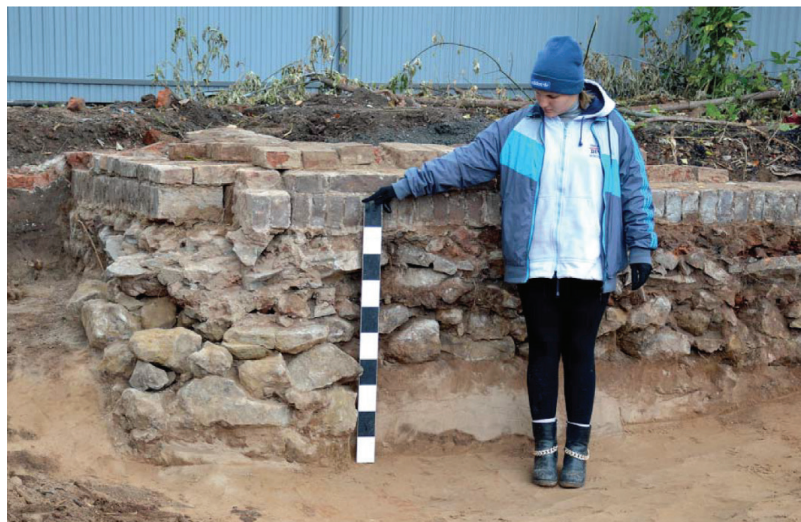
Рис. 4. Сооружение №3. Фиксация бутовой кладки фундамента