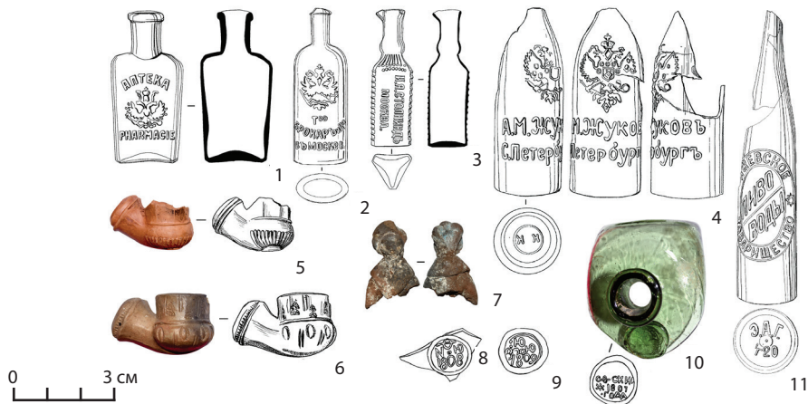
Рис. 7. Вещи из погребов: 1–4, 11 — стеклянная посуда; 5, 6 — глиняные курительные трубки; 7 — фрагмент глиняной дымковской игрушки; 8–10 — пломбы от стеклянных коньячных бутылок Fig. 7. Things from the cellars: 1–4, 11 — glassware; 5, 6 — clay smoking pipes; 7 — a fragment of a clay Dymkov toy; 8–10 — brands from glass cognac bottles

А.М. КРЮКОВА ... НЕМЪ НОВГОРОДЕ». Кроме того, сохранились две керосиновые лампы с клеймами всероссийской выставки 1882–1886 гг. и изображением императора Александра III. На фарфоровой посуде были обнаружены клейма Рижского завода (1864–1880 гг.), Тверской фабрики (1870–1889 гг.), заводов А.Г. Зацепина (1885–1898 гг.), Карякина и Рахманова (1886–1894 гг.), М.М. Куринова (конец XIX — начало XX в.), И.Е. Кузнецова (1880–1913 гг.), братьев Барминых (1895–1918 гг.), Будянской (1889–1917 гг.), Дмитровской (1891–1918 гг.), Волховской (1880–1918 гг.) фабрик (Музина, 1995; Селиванов, 2002; Дулькина, 2003; Русский фаянс..., 2010).