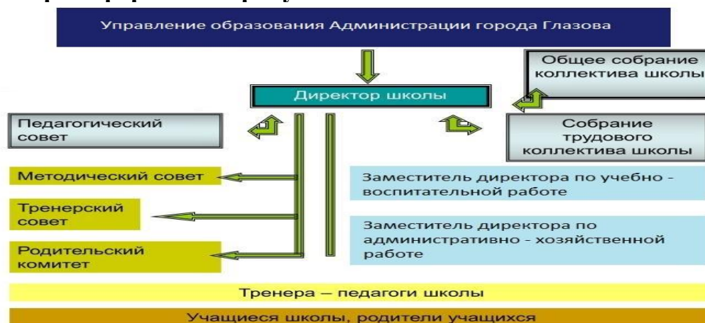
Рисунок 1 – Структура управления МБОУ ДО «ДЮСШ № 1» г. Глазова