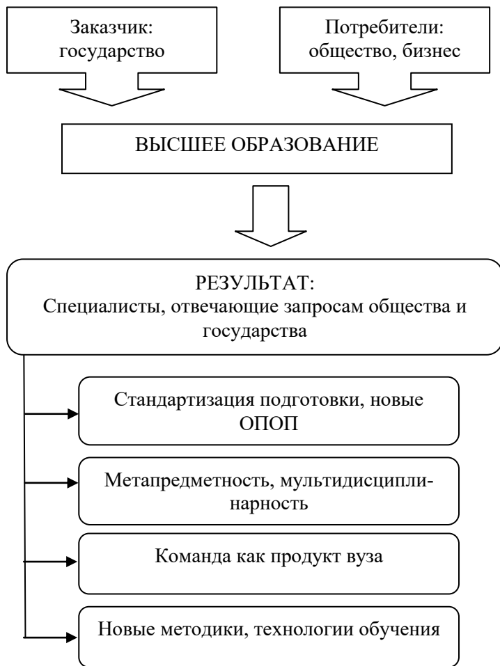
Рисунок 3. Прогноз направлений инновационного развития высшего образования РФ [95]

новых стратегических научных направлений, технологических достижений и форм взаимодействия всех целевых групп, которые в долгосрочной перспективе смогут оказать значительное влияние на подготовку специалистов, отвечающих запросам общества и государства.