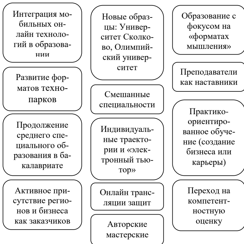
Рисунок 2. Карта форматов: вуз [52]

На рис. 3 в общем виде представлены основные перспективы развития отечественного высшего образования, в значительной степени коррелирующие с выводами разработчиков форсайт-проекта «Образование-2030».