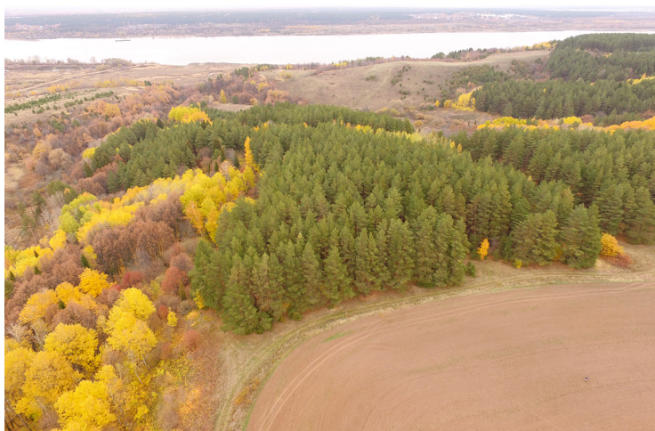
Момылевские могильник и IV селище

В тыловой части мыса, на котором расположен Момылевский могильник, при осмотре распахиваемой поверхности коренного правого берега Камы были собраны в большом количестве фрагменты лепной керамики, куски обмазки, фрагменты тигля и терочной плиты. Площадь распространения находок, приуроченных к двум всхолмлениям рельефа, составила 27000 кв. м. В трех заложенных шурфах культурный слой оказался полностью перепаханным. Объект поставлен на государственный учет как Момылевское IV селище. Датировка селища предложена предварительно, на основании характеристик лепной керамики – IV–III вв. до н. э.