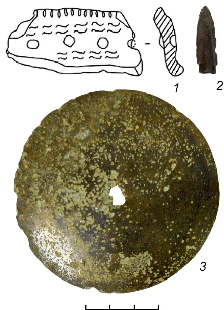
Момылевское III селище: 1 - фрагмент керамики, 2 - медный наконечник стрелы Момылевский могильник: 3 - бронзовая бляха