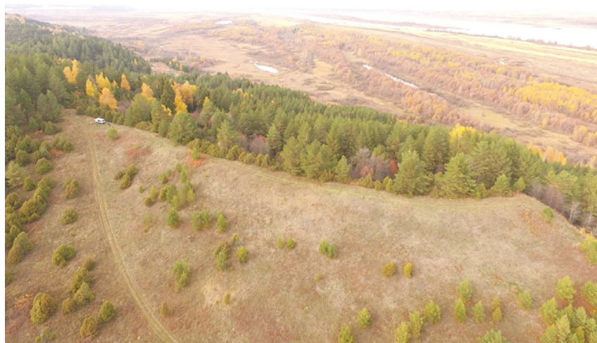
Момылевское III селище