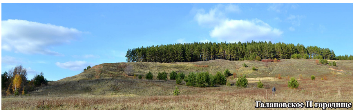
Галановское III городище

В ходе осмотра установлено, что поверхность мыса, прежде частично занятая строениями деревни, в настоящее время свободна и распаивается. По ней проложены наезженные грунтовые дороги. От домов деревни, отмеченных на топоплане 1975 г., сохранились руины одного, а также впадины двух других. Основными точками привязки места раскопок (весьма условное) на актуальном инструментальном плане послужили рельеф, руины дома, русло реки. Для более точной локализации раскопа 1975 г. и оценки изученности могильника требуется проведение земляных работ.