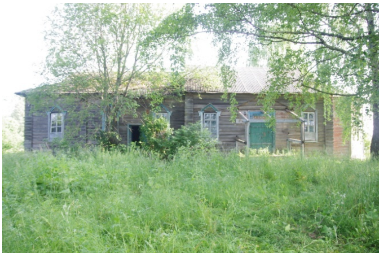
Уть-Сюмси. Южный фасад.