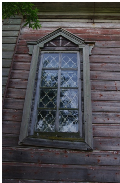
Уть-Сюмси. Окно с наличником и кубоватая решетка