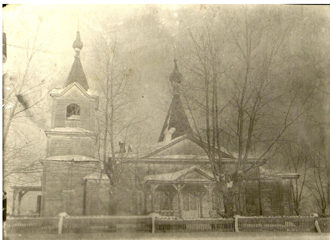
Большая Чепца, февраль 1941 г. ЦГА УР. Ф. Р-620. Оп. 1. Д. 1230. Л. 27