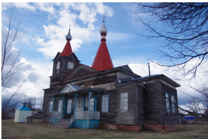
Сретенский храм, апрель 2018 г.