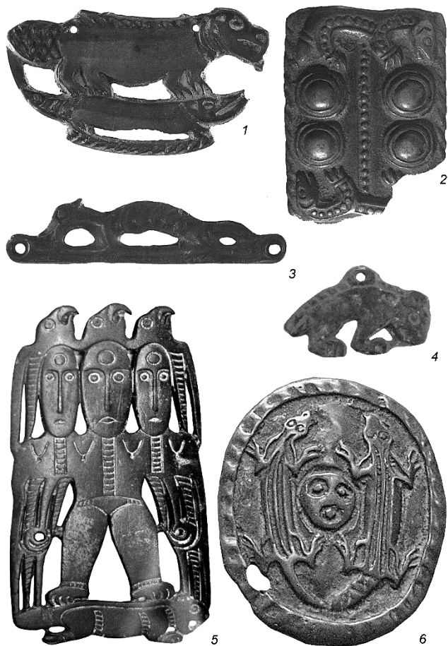
Рис. 1. Культовые пластины с изображениями пушных зверей. 1 – пластина с двумя ящерами (верхний – бобр, нижний – щука). VII-VIII вв., Пермский край; 2 – пластина с изображением пушных зверьков. VIII-IX вв. Д. Филатово Пермского края; 3 – пластина с изображением пушного зверька. VII-VIII вв. Пос. Калино Пермского края; 4 – подвеска с изображением бобра. III в., погр. 1679 Тарасовского могильника; 5 – пластина с изображением трехликой богини, стоящей на ящере (бобре). VIII-IX вв., д. Усть-Каиб Чердынского района Пермского края; 6 – пластина с изображением личины и двух пушных зверьков (правый – бобр). VIII-IX вв., с. Янидор Пермского края. 1-6 – бронза. 1-3,5,6 – по В.А. Оборину, Г.Н. Чагину, 4 – по Р.Д. Голдиной.