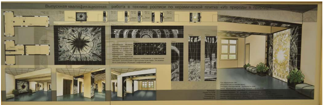
Рисунок 5 - Насипова А. Графическое сопровождение декоративного панно «Из природы в природу», рук. Быковский В.И.