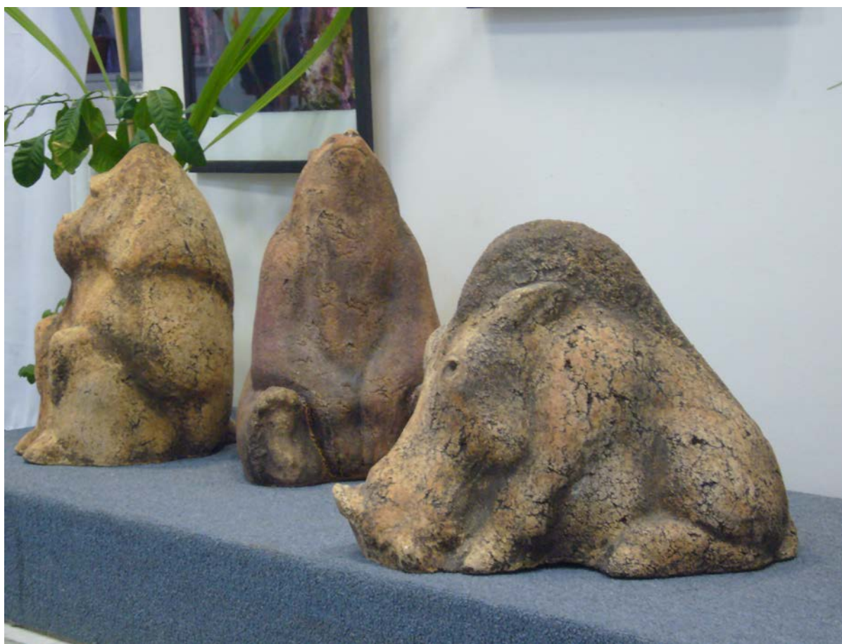
Рисунок 8 – Чувашев А. Керамическая декоративная композиция «Звери», рук. Сафиуллин А.Г.