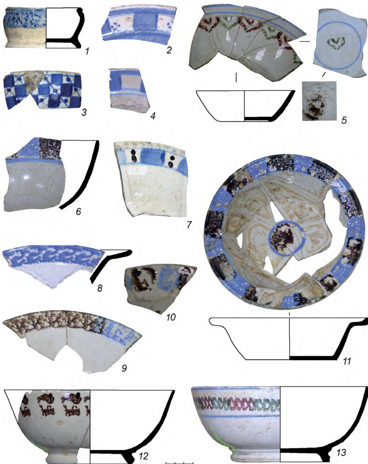
Рисунок 2 – Фрагменты фаянсовой посуды из объектов по ул. Красная поселения «Ижевский завод»