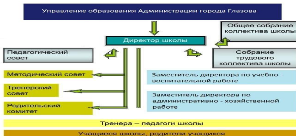
Рисунок 1 – Структура управления МБОУ ДО «ДЮСШ № 1» г. Глазова