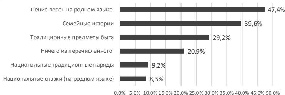
Рис. 1. Распределение ответов респондентов на вопрос о сохранившихся элементах традиционной культуры

Некоторые вещи определяются участниками исследования как предметы, которые просто «остались на память», хотя информанты испытывали импульс, чтобы перечислить их в ответ на вопрос исследователя. К таким относились простыни с подзорами, керосиновый фонарь, старые ворота. Случалось, что вещи были связаны с ремеслом членов семьи, например, сапожный инструмент деда (Инт. 20), корзины и короба, которые сделал отец (Инт. 18). Информанты подчеркивали эмоциональную связь с этими родственниками. Например, молодой человек сообщил о гитаре, браслете и фотопроекторе отца (Инт. 28), а