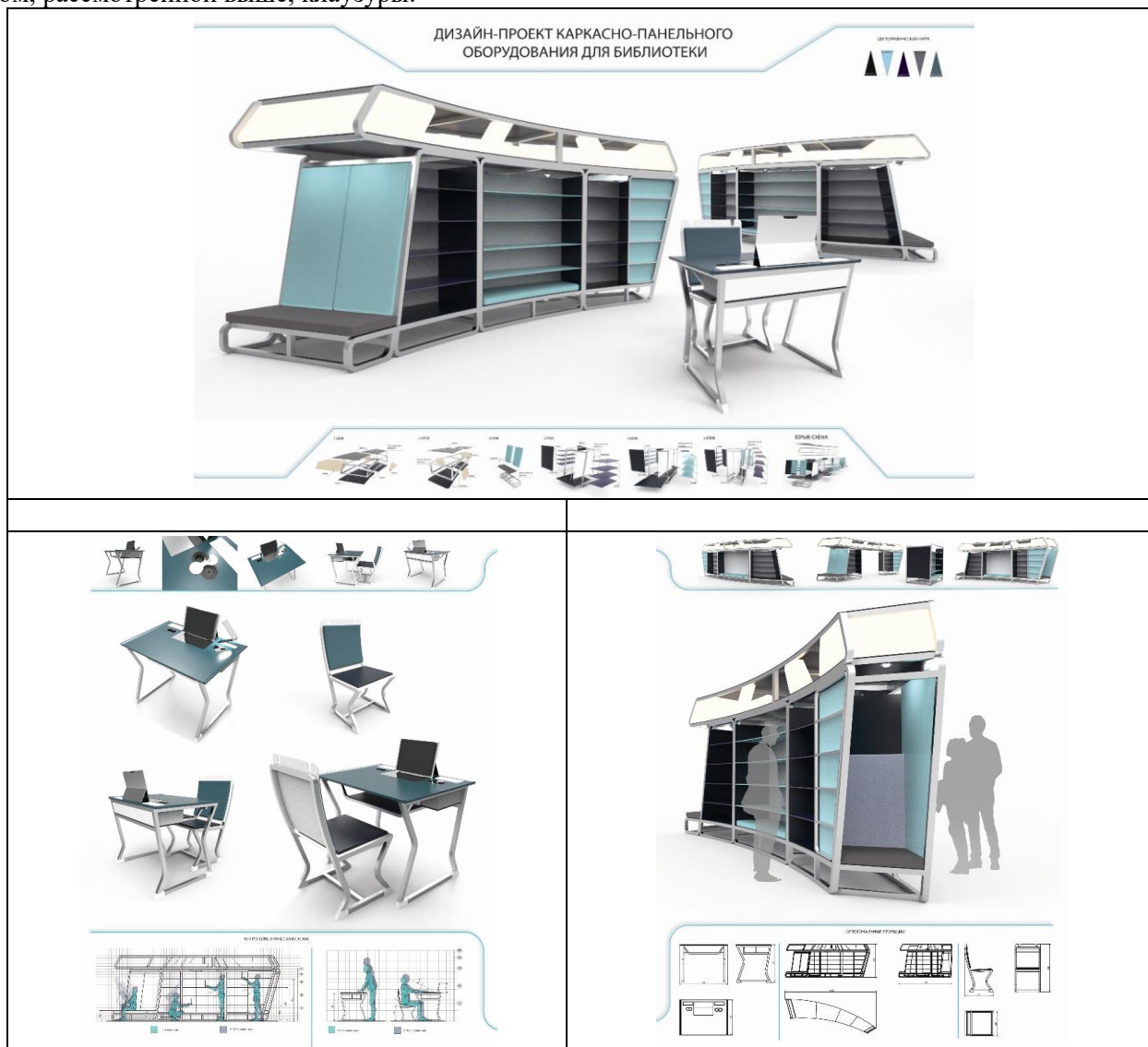
Рис. 3. Учебный дизайн-проект объектов по художественно-смысловому образу «Космическая бесконечность книжных миров»

Рассмотрим результат трансформации художественной идеи в учебный дизайн-проект оборудования для помещения библиотеки (рис. 3), функционал которого, в принципе, хорошо согласуется со смысловых посылом, рассмотренной выше, клаузуры.