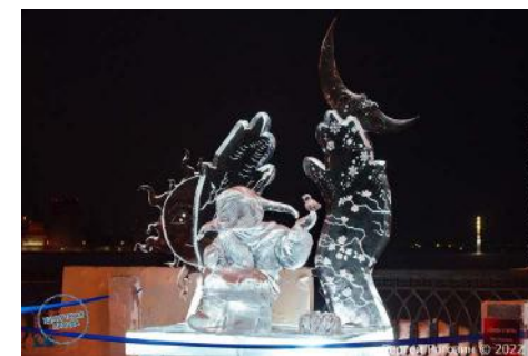
Рис. 7. И. Локтюхин. «Дверь в лето». г. Хабаровск. «Удмуртский лед», 2022 г.

Подводя итог анализа художественно-стилевых качеств ледовой скульптуры Дальневосточного региона, нужно подчеркнуть уникальность, в сравнительном контексте с другими вышеперечисленными группами, что, очевидно, является результатом тесного соседства с такими странами, как Китай и Япония. Проведя аналитическую работу ледовой скульптуры данной группы, можно выявить следующий комплекс уникальных