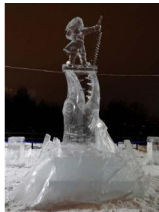
Рис. 4. Р. Исмагилов, К. Сиряченко (г. Пермь). «Йопонна». «Удмуртский лед», 2020 г.