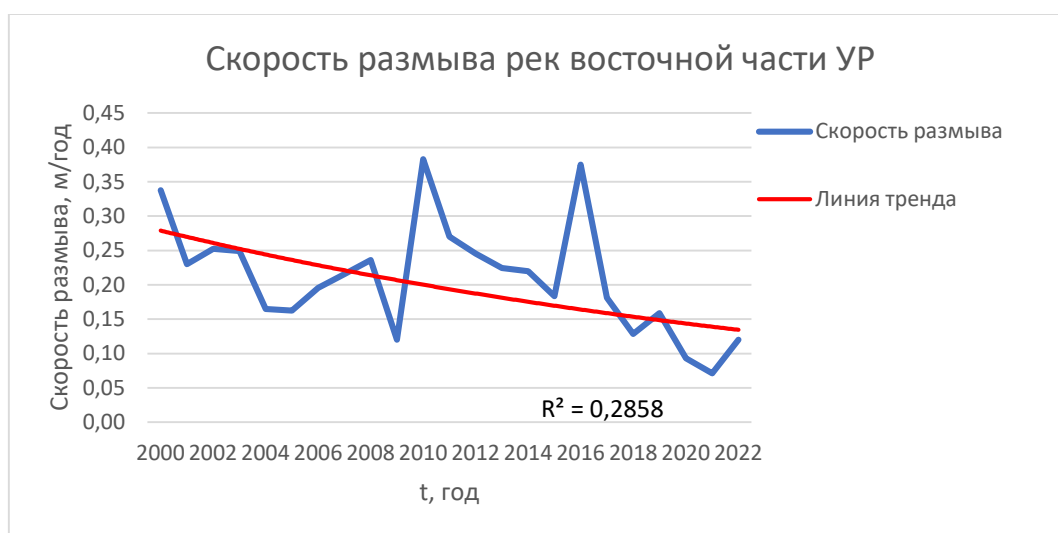
Рисунок 3. График изменения средней скорости размыва берегов на реках восточной части Удмуртии за период 2000-2022 гг., составлено автором

В южной части Удмуртии протекает наименьшее количество рек. К исследуемым рекам относятся такие реки, как Агрызка, Умяк, Бобинка, Кырыкмас, Варзинка, Кобылка, Пизь, Алнашка, Адамка, Вятка.