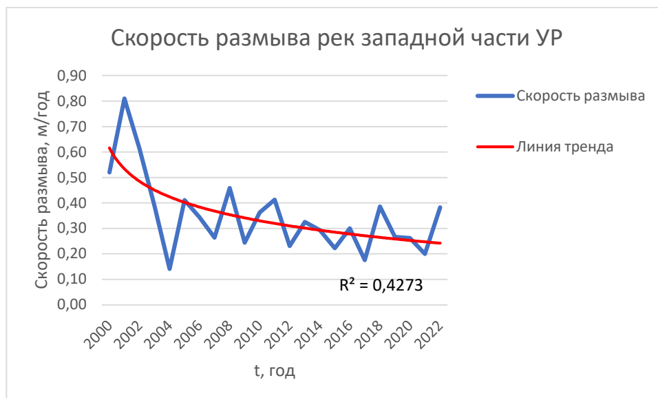
Рисунок 2. График изменения средней скорости размыва берегов на реках западной части Удмуртии за период 2000-2022 гг., составлено автором

К исследуемым рекам западной части Удмуртии относятся такие реки, как Ува, Нылга, Вала, Постолка, Кильмезь, Арлеть, Лумпун. Средние скорости отступления берегов по исследуемым рекам западной части составляют порядка 0,30-0,35 м/год. За период с 2000 по 2022 года наблюдается тренд уменьшения скоростей размыва берегов, величина достоверности аппроксимации ( R^2 ) составляет 0,4273 (рисунок 2). Максимальная среднегодовая скорость наблюдалась в 2001 г. – 0,81 м/год, минимальная в 2004 г. – 0,14 м/год. Из всех рек западной части максимальная скорость была зафиксирована в 2001 г. на р. Кильмезь в районе деревни Головизнин Язок, составив 2,24 м/год; минимальная скорость размыва была отмечена в 2021 г. – 0,02 м/год – на р. Арлеть у деревни Чибирь-Зюнья и на р. Кильмезь у д. Малые Сюмси.