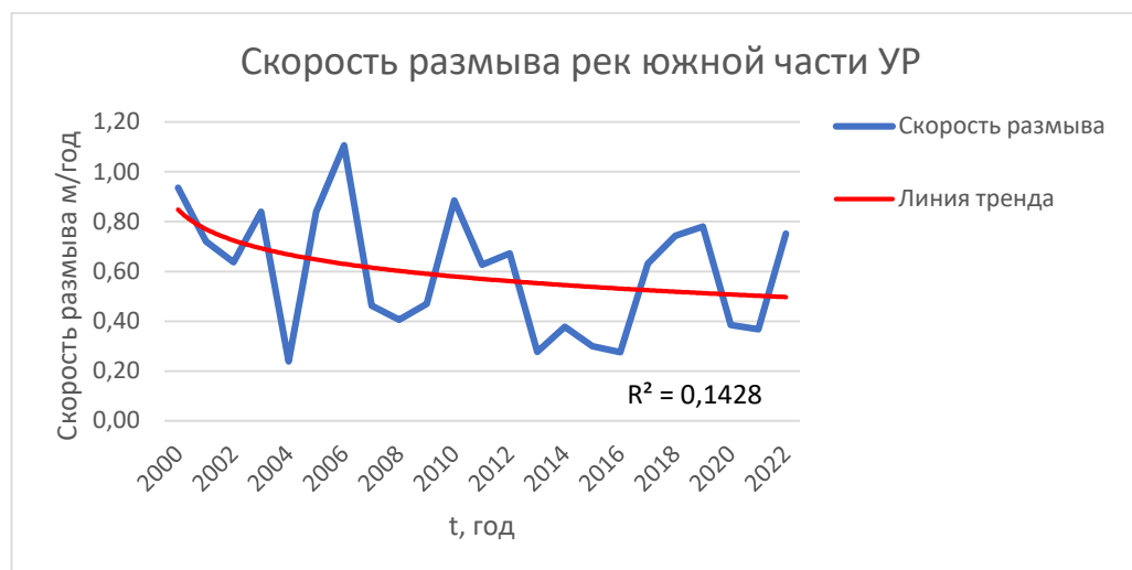
Рисунок 4. График изменения средней скорости размыва берегов на реках южной части Удмуртии за период 2000-2022 гг., составлено автором

Средние скорости отступления берегов по исследуемым рекам юной части составляют порядка 0,55-0,60 м/год. За период с 2000 по 2022 года наблюдается тренд уменьшения скоростей размыва берегов, величина достоверности аппроксимации ( R^2 ) составляет 0,1428 (рисунок 4). Максимальная среднегодовая скорость наблюдалась в 2006 г. – 1,11 м/год, минимальная в 2004 г. – 0,24 м/год. Из всех рек южной части максимальная скорость была зафиксирована в 2002 г. на р. Вятка в районе села Крымская Слудка, составив 4,53 м/год; минимальная скорость размыва была отмечена в 2021 г. – 0,01 м/год – на р. Алнашка у села Алнаши.