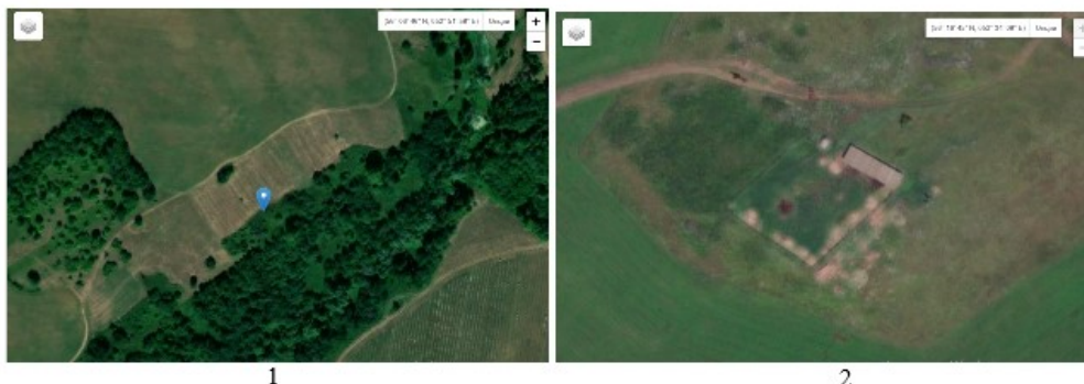
Рисунок 3. Фотоизображения исчезнувших деревень: на 1 снимке территория деревни Красный Яр (исчезла в 1994 году), на 2 снимке деревня Шарыпово (исчезла в 1971 году), составлено автором

После создания тематических карт были проанализированы космические снимки, полученные из архива Геологической службы США (USGS) сервиса EarthExplorer. На основе данных снимков по дешифровочным признакам (границы бывших участков, разрушенные постройки, полевые дороги) выявлены остатки от ныне не существующих деревень (рисунок 3). Благодаря этим снимкам, не опираясь на данные Подворной описи, можно найти более точное расположение НП.