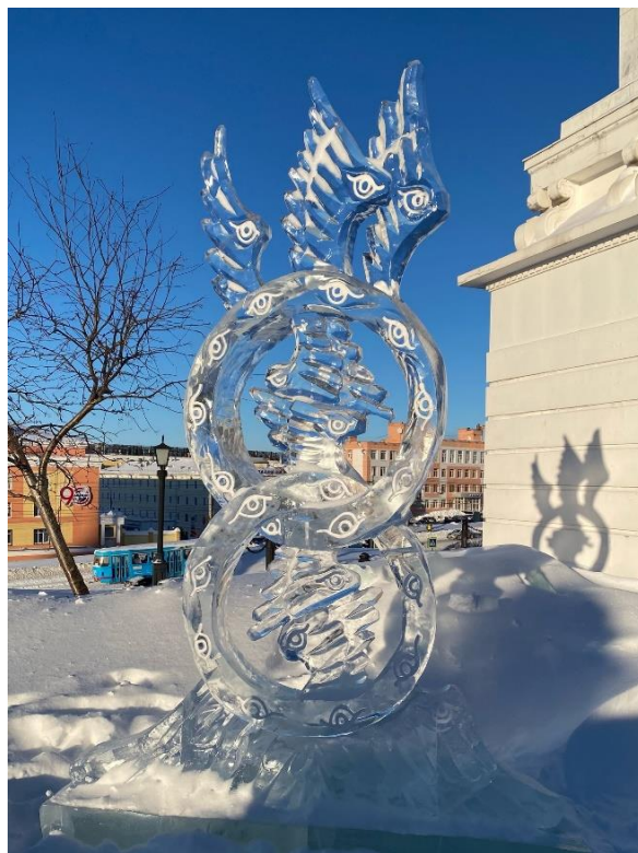
Рис.1. «Престолы», Я. Троянский, г. Ижевск, 2024 г.

скульптуре был придан структурный вид и прочность конструкции, а все плоскости заполнены отгравированными во льду изображениями глаз (рис. 1).