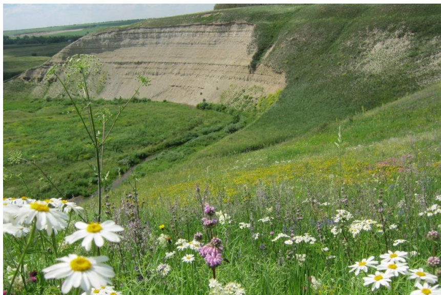
Рис. 3. Памятник природы «Склоны Коржинского»