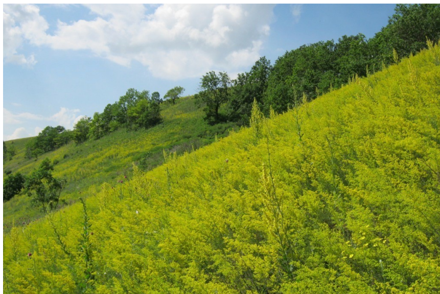
Рис. 2. Лесостепной склон долины р. Зай близ с. Борок