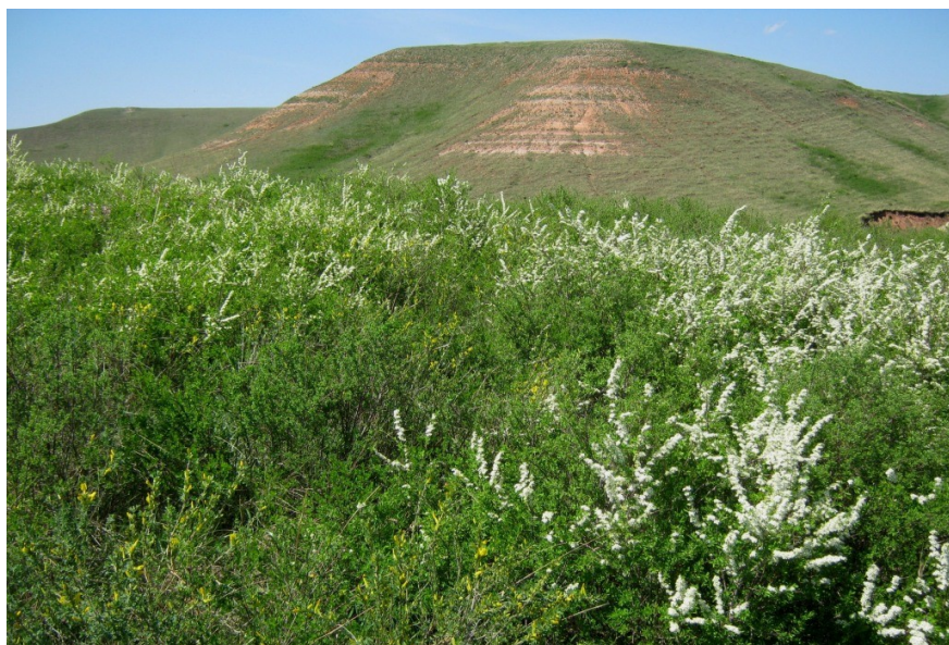
Рис. 11. Кустарниковая степь у подножия Ратчинских гор