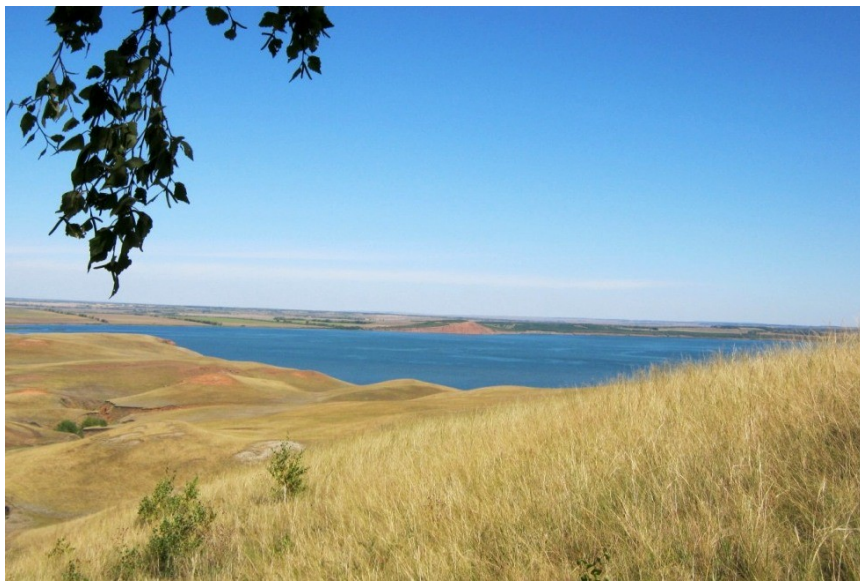
Рис. 6. Ковыльные степи природного парка «Аслы-Куль»