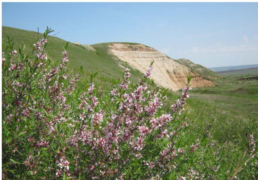
Рис. 5. Памятник природы «Салиховская гора»