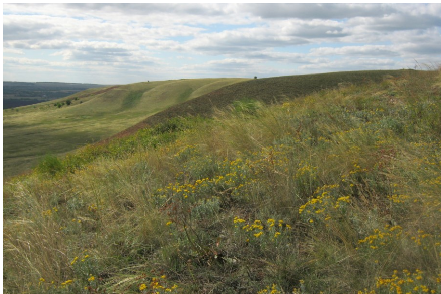
Рис. 8. Памятник природы «Серноводский шихан»