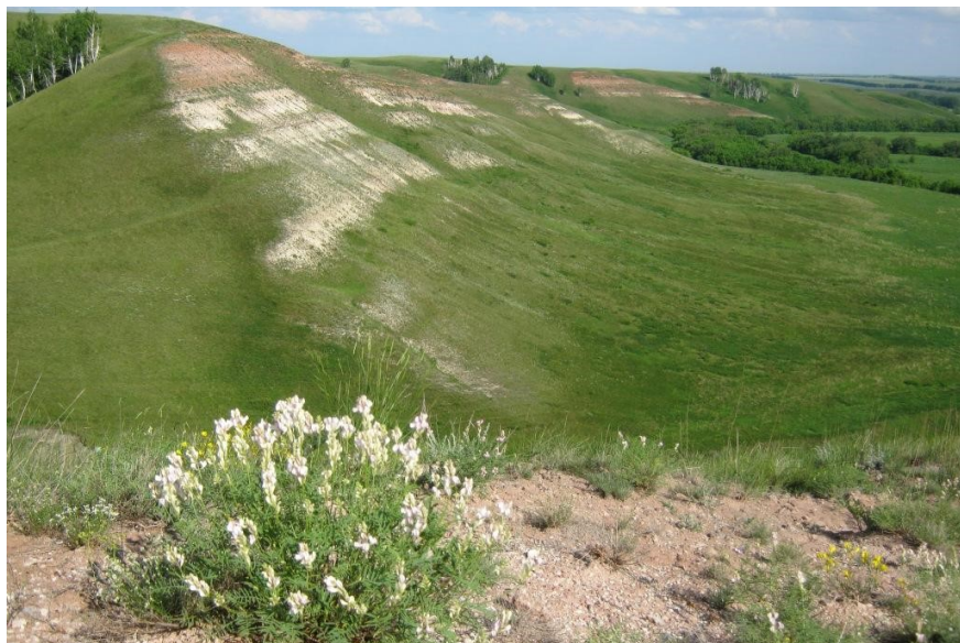
Рис. 10. Памятник природы «Белая Гора»