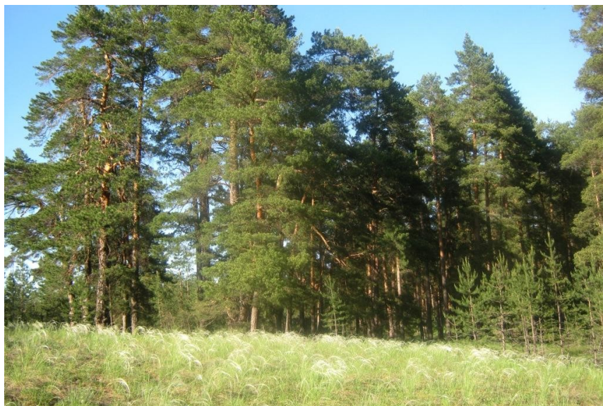
Рис. 12. Псаммофитно-ковыльные степи по окраинам Бузулукского бора

10. Национальный парк «Бузулукский бор» на песках надпойменных террас рек Боровки и Самары: Бузулукский р-н Оренбургской (52.96° с. ш., 52.06° в. д.) и Борский р-н Самарской (53.01° с. ш., 51.74° в. д.) областей (рис. 12). Более двух третей парка занято сосновыми и смешанными лесами. Степи представлены локально, в основном псаммофитными вариантами по опушкам остепнённых сосняков (Чибилёв и др., 2009; Власова и др., 2010).