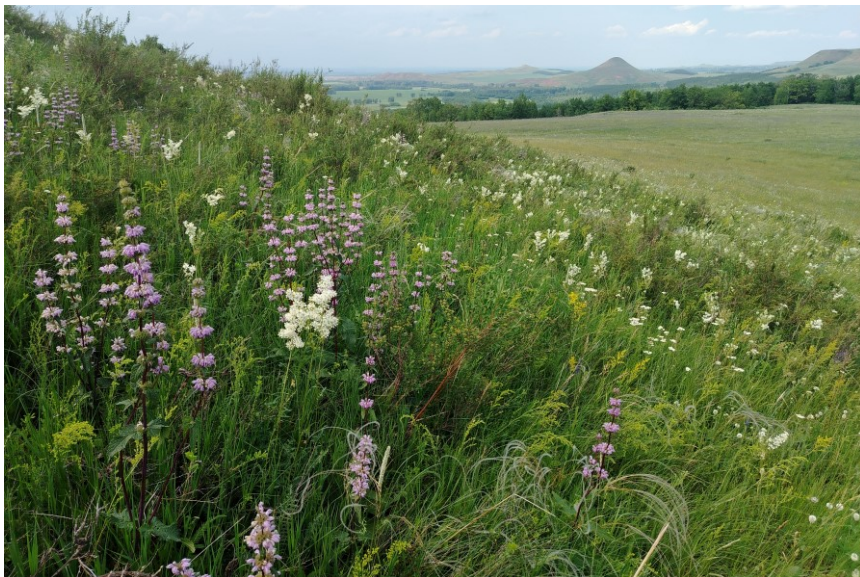
Рис. 7. Разнотравная степь на склоне горы Сатыртау (на горизонте виден конус горы Сусактау)