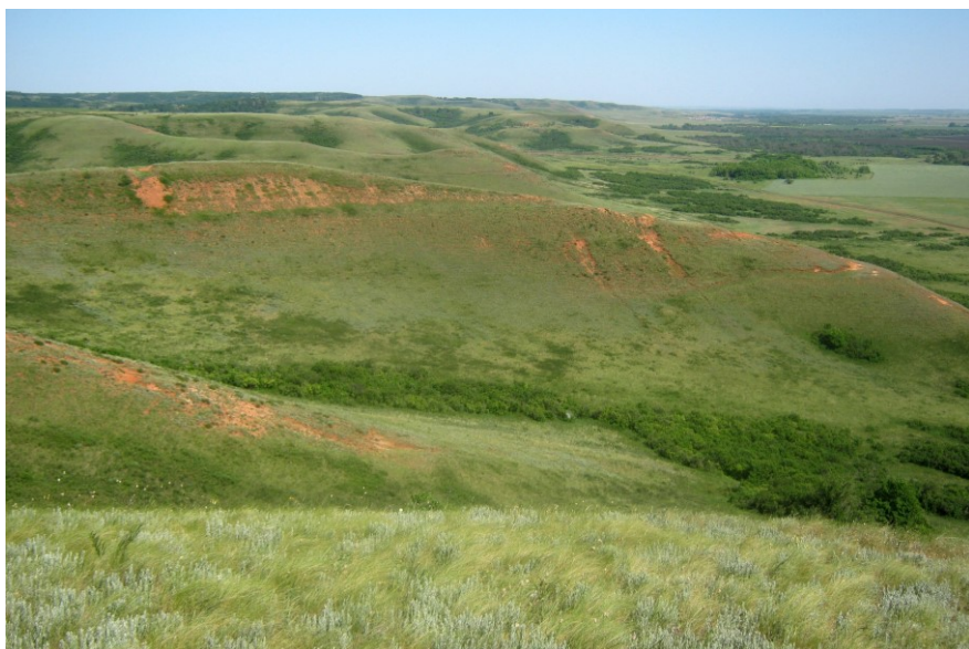
Рис. 9. Памятник природы «Малокинельские яры»