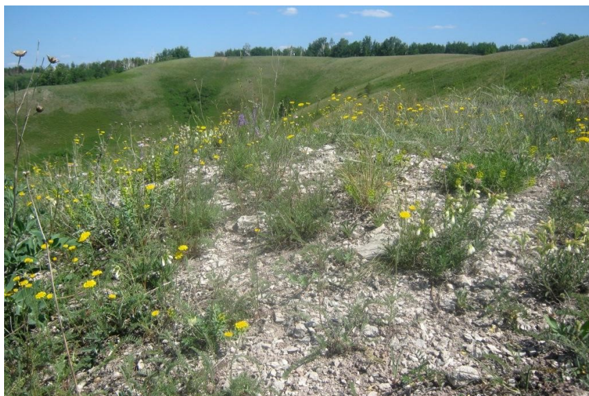
Рис. 4. Петрофитные ассоциации на Карабашской горе