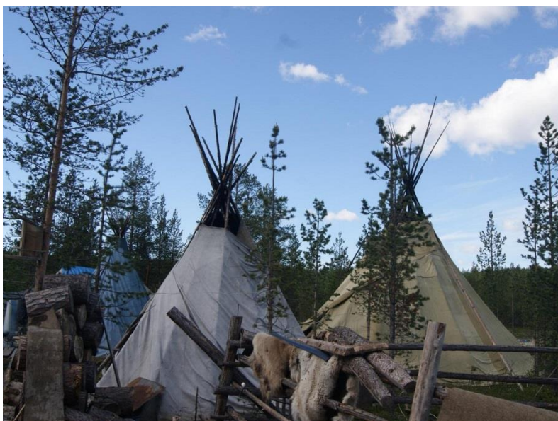
Рис. 7. Саамская деревня «Самь-Сыйт»

В комплекс саамской деревни входят: национальные жилища саамов, кафе «Петроглифы», гостевой дом с баней, кораль (загоны) и лем (навесы-шалаша) для оленей, хозяйственные постройки. Комплекс для обслуживания туристов располагает квадроциклами и снегоходами. Продолжительность полной экскурсии составляет 3 часа.