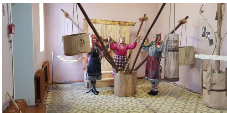
Рис. 40. Тангыра «Древо мира». Центр удмуртской культуры с. Булай