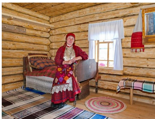
Рис. 20. Интерьер бесермянской избы

Передний угол располагается по диагонали от печи. Прежде в передней части избы располагались у входа нары, позже кровать. По периметру стен располагались широкие лавки, в красном углу размещался стол (рис. 20). К потолку подвешена колыбель.