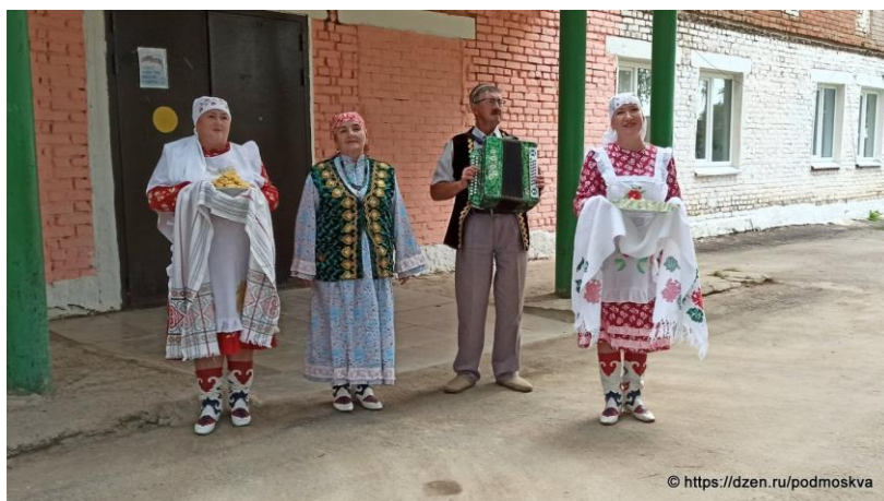
Рис. 44. Встреча гостей в д. Кестым

На туристической карте Удмуртия представлена не только как полиэтническая, но и как поликонфессиональная территория. Туристический маршрут «Легенды Кестыма» – это культурно-познавательное, гастрономическое путешествие, знакомящее с миром татарской исламской культуры (рис. 44).