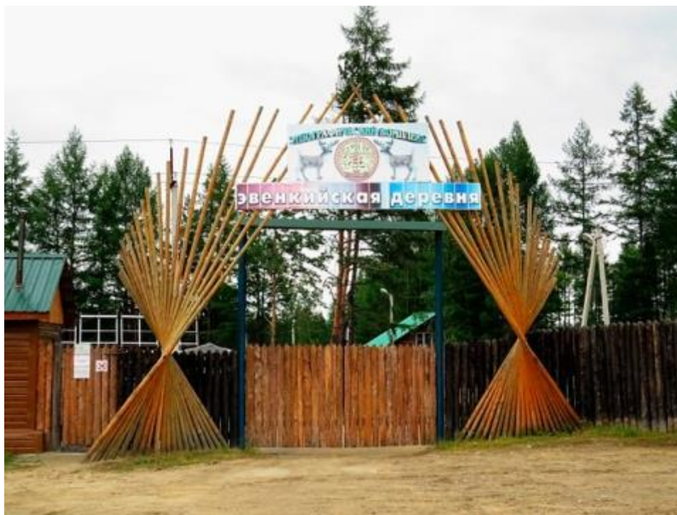
Рис. 8. Этнографический комплекс «Эвенкийская деревня» в Амурской области

Рассмотрим подробнее этнографический комплекс «Эвенкийская деревня» в Амурской области (рис. 8).