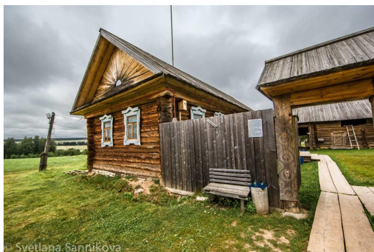
Рис. 15. Усадьба южных удмуртов

Южный тип застройки – это более рассредоточенное расположение жилых и хозяйственных построек, открытые покосеобразные дворы с симметричными или ассиметричными воротами, часто встречается общая угловая кровля нескольких надворных построек.