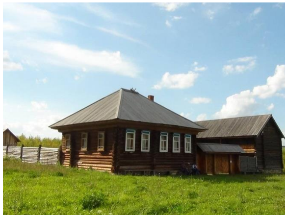
Рис. 21. Усадьба северных удмуртов

В усадьбе верхнечепецких удмуртов гости смогут увидеть дом и двухэтажный амбар, которые перевезены из деревни Стеньгурт Кезского района Удмуртии. Постройки 1925–1926 годов принадлежали зажиточным крестьянам (рис .21).