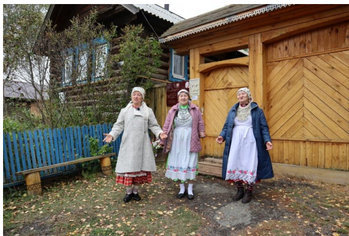
Рис. 25. Центр удмуртской культуры в дер. Карамас-Пельга

Быдззым куала, как и восстановления забытых обрядов, были местные старожилы из общества удмуртской культуры. В 2004 году усадьбу выкупило районное управление культуры, и 6 лет она функционировала как Дом ремесел. А в 2010 году в Киясово приняли целевую программу развития въездного туризма, и с тех пор здесь располагается Центр удмуртской культуры (рис. 25). Кстати, молельный дом восстановили в первую очередь. Теперь это снова сакральное место, входить в которое можно только по особым случаям, например, в Ильин день, 2 августа.