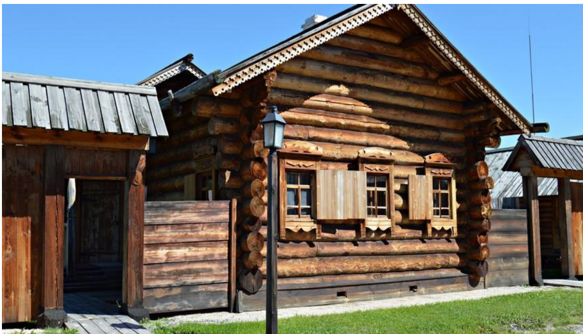
Рис. 1. Историко-этнографический музей-заповедник «Шушенское»

Это уникальный комплекс под открытым небом, исторически сложившаяся центральная часть сибирского села кон. XIX – нач. XX вв. Общая площадь музея – около 16 га. В мемориальной части экспозиции представлены 29 домов, из них 23 – подлинные, построенные в конце XIX столетия. В домах и на усадьбах воссозданы условия жизни сибиряков, отражены основные занятия крестьян, показаны подсобные промыслы и ремёсла. В двух домах, где квартировал в годы ссылки В.И. Ленин, сохраняется мемориальная обстановка. Музей-заповедник «Шушенское» является особо ценным объектом культурного наследия Красноярского края.