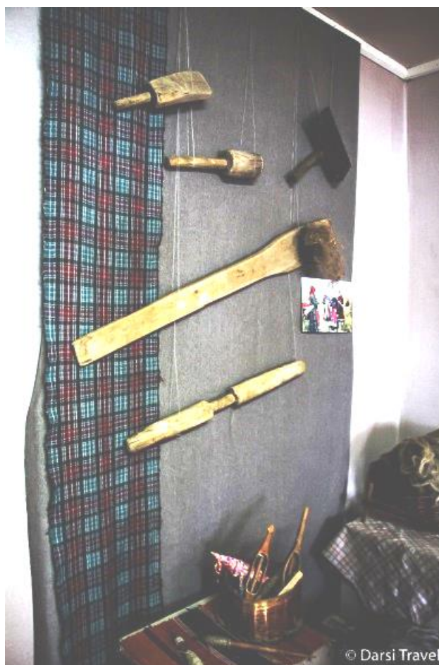
Рис. 31. Центр удмуртской культуры в дер. Сундур. Дом Лопшо Педуня (мужской зал)

Во дворе стоят традиционные надворные постройки удмуртов – амбар-кенос (летнее неотапливаемое жилище), баня, лабаз – место для хранения сельскохозяйственного инвентаря, а сам двор является игровой, развлекательной площадкой для гостей центра (рис. 32).