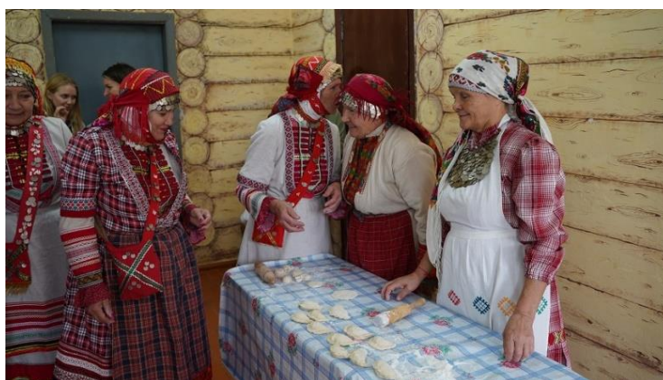
Рис. 43. Бесермяне за приготовлением пирожков