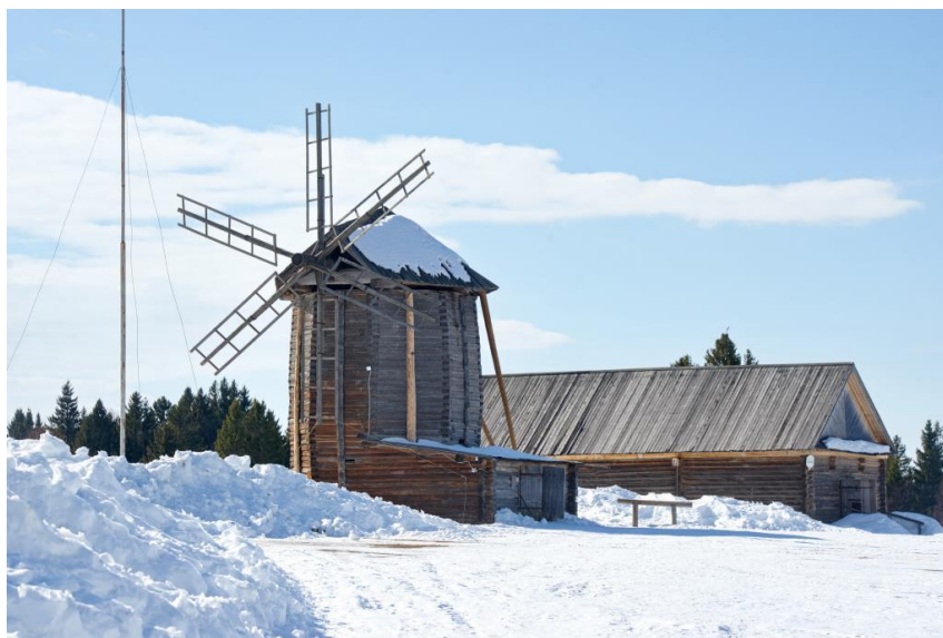
Рис. 14. Ветряная мельница.

Главная достопримечательность музея – ветряная мельница (рис. 14). Это трехъярусное строение шатрового типа, с оборудованием и внутренним наполнением, которое готово к работе, и его можно запустить. Сегодня это одна из шести действующих мельниц в России. По праздникам ее приводят в движение, мелют муку, из которой готовят угощения для гостей.