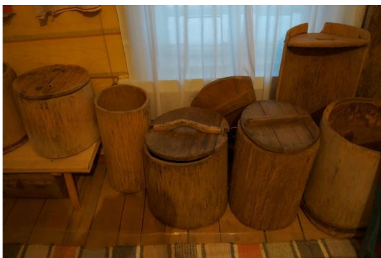
Рис. 42. Экспонаты краеведческого музея

В самом музее уже более 20 лет хранится память о прошлом. Сюда односельчане несли все сохранившиеся в бабушкиных сундуках и домашних чуланах семейные реликвии – старинные тканые и вышитые полотенца и скатерти, одежду, кухонную утварь, орудия труда и ремесел и т. д. (рис. 42).