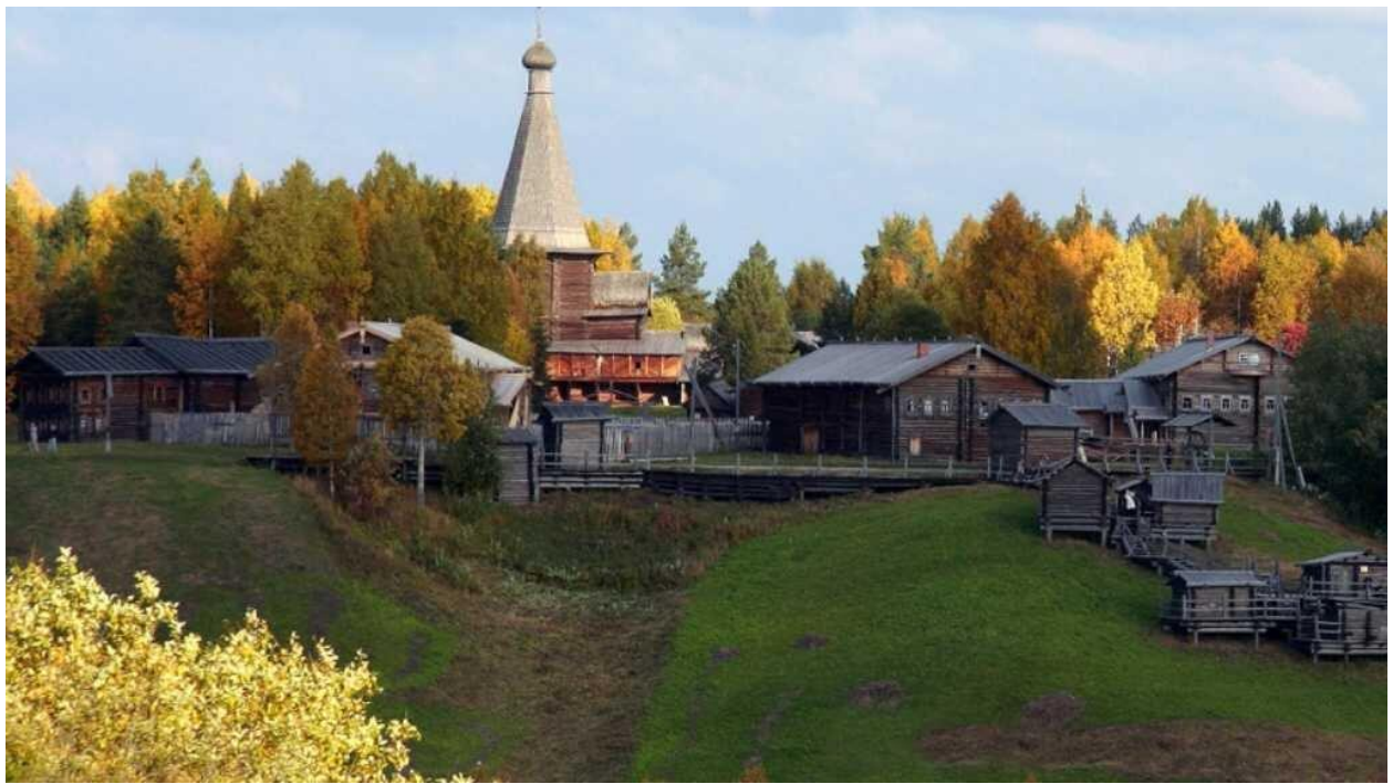
Рис. 5. Архангельский государственный музей деревянного зодчества и народного искусства «Малые Карелы»

Музей «Малые Карелы» – это крупнейший в России музей деревянного зодчества под открытым небом, основанный в 1964 г. В 25 км от Архангельска на территории площадью 140 га сосредоточены 120 разноплановых строений – церквей, часовен, колоколен, крестьянских усадеб, мельниц, амбаров, построенных в XVI – нач. XX вв. Музей разделен на 4 сектора: Каргопольско-Онежский, Мезенский, Двинской и Пинежский, каждый из которых представляет деревню, характерную для этого региона.