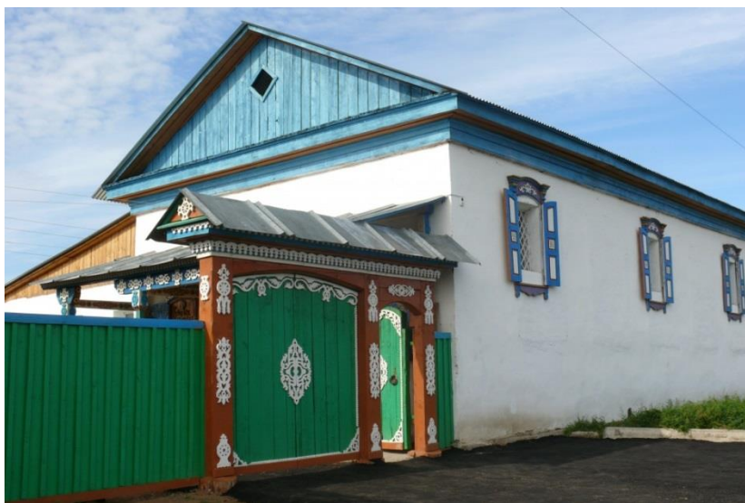
Рис. 9. Музей истории культуры и быта старообрядцев Забайкалья

Усадьба забайкальского старообрядца включает ремесленную мастерскую, завозню, смотровую площадку, дом крестьянина, амбары, музей истории культуры и быта старообрядцев Забайкалья, а также исторические здания (часовня Епископа Афанасия постройки 1911 г., дом уставщика конца XIX в.). Музей и усадьба забайкальского старообрядца насчитывают около 8 000 предметов обихода, одежду, орудий труда. Интересна коллекция тульских самоваров, которые с 80-х гг. XIX в. стали важной деталью интерьера семейских домов в Забайкалье. Самовар был показателем достатка, богатства и гордости семейских. Богатая коллекция изделий из керамики: горшки, крынки, кувшины.