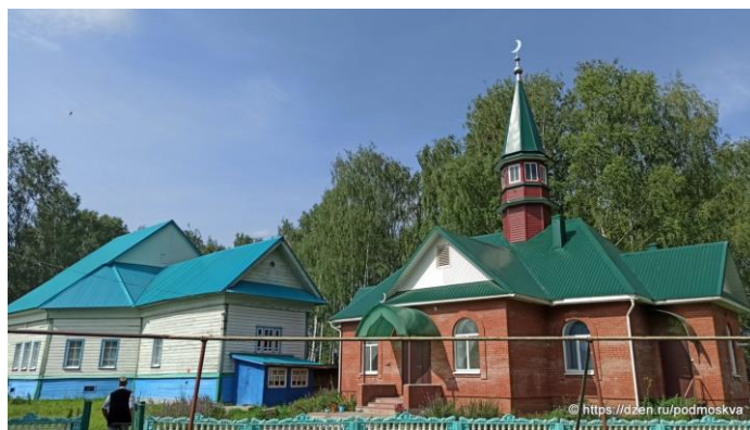
Рис. 45. Мечети д. Кестым