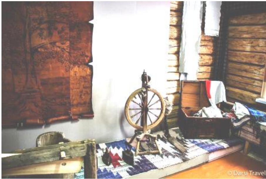
Рис. 29. Центр удмуртской культуры в дер. Сундур. Дом Лопшо Педуня (женский зал)