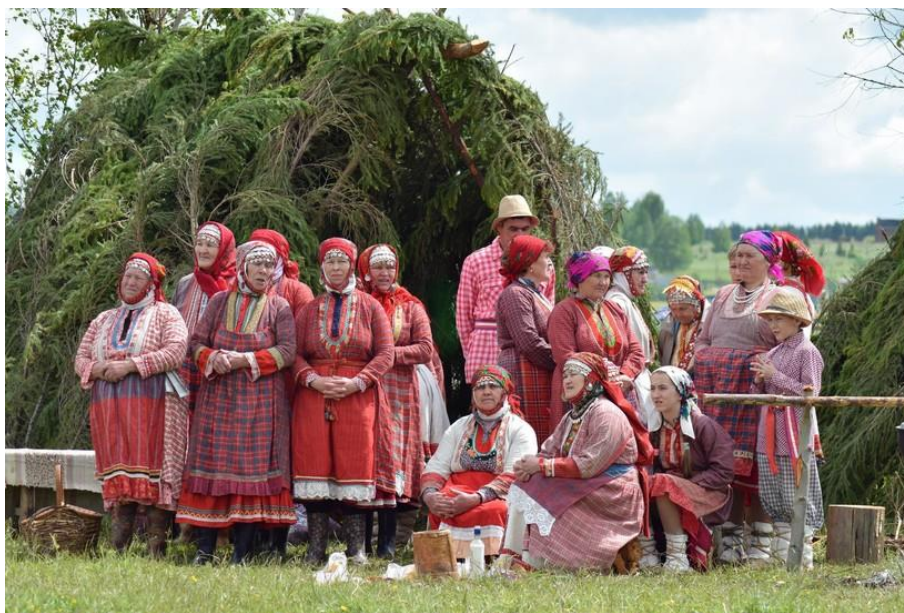
Рис. 41. Бесермяне

2. Бесермяне – это удмурты, испытавшие сильное тюркское влияние. После разгрома Волжской Булгарии монголо-татарами бесермяне бежали на Вятку, оттуда попали в бассейн р. Чепцы и ее притоков. С тех пор они живут среди северных удмуртов, хотя и сохраняют южно-удмуртский диалект. Постепенно вместе с удмуртами бесермяне стали христианами. Живут бесермяне в Ярском, Юкаменском, Балезинском районах Удмуртской Республики и Слободском районе Кировской области. Однако сохраняется этническая специфика в материальной и духовной культуре (одежда, песни, танцы, обряды), языке. Создано Общество бесермянского народа (г. Глазов, 1990).