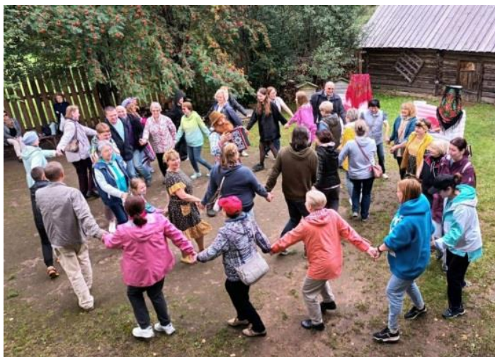
Рис. 32. Центр удмуртской культуры в дер. Сундур

Во дворе стоят традиционные надворные постройки удмуртов – амбар-кенос (летнее неотапливаемое жилище), баня, лабаз – место для хранения сельскохозяйственного инвентаря, а сам двор является игровой, развлекательной площадкой для гостей центра (рис. 32).