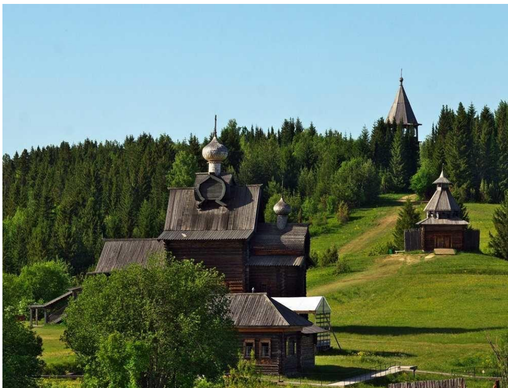
Рис. 2. Архитектурно-этнографический музей «Хохловка»

В музее представлены ремесла, элементы традиционного быта, краеведение, проходят театрализованные мероприятия, имеются смотровые площадки и пункты фотографирования. Музей доступен для посещения людьми с ограниченными физическими возможностями. На территории музея «Хохловка» ежегодно проводятся, ставшие традиционными, массовые мероприятия, праздники народного календаря «Проводы Масленицы», «Троицкие гуляния», «Яблочный Спас», фольклорные музыкальные праздники, фестиваль военной реконструкции «Большие манёвры на Хохловских холмах» и международный фестиваль «КАМWA». Для размещения и питания туристов используется инфраструктура, расположенная в Постоялом дворе рядом с территорией музея.