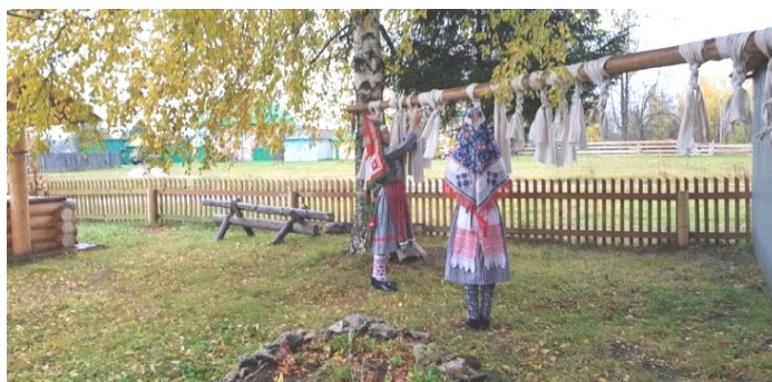
Рис. 38. «Небесный столп». Культурный квартал с. Булай

Композиция «Небесный столп» («Ин юбо») расположена на своеобразном тайном местечке, которое находится между двух берез (рис. 38). У удмуртов всегда считалось, что березы – это священные деревья, поэтому только между таких деревьев они могли создать такое место. Небесный столп – это образ, который восходит к ряду мифологических конструктов типа земной оси, небесного столпа, что связывает земную поверхность с небесной сферой. Также Ин юбо олицетворяет незыблемость мироздания.