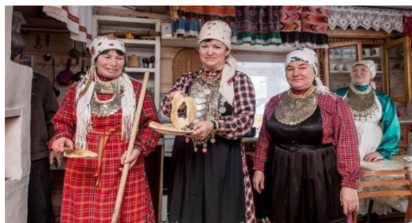
Рис.26. Центр удмуртской культуры в дер.Карамас-Пельга

Туристам и гостям предлагается очень интересная этническая программа. При желании в Карамас-Пельгу можно приехать с чисто гастрономическими целями (рис. 26).