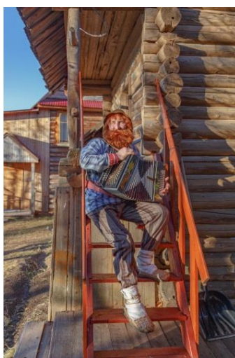
Рис. 34. Лопшо Педунь