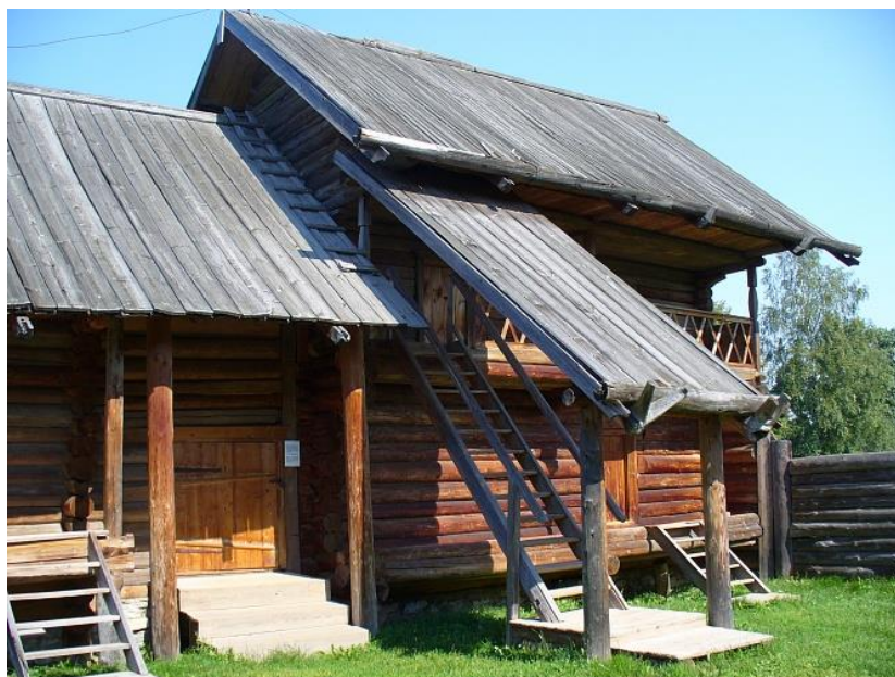
Рис. 16. Амбар центральных удмуртов