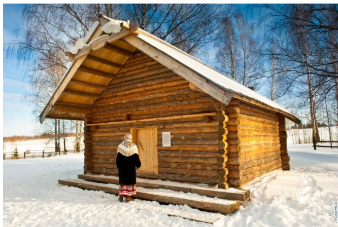
Рис. 22. Быдзым куала. Великое святилище удмуртов

Среди культовых построек, находящихся на территории Лудорвая и знакомящих с духовной культурой удмуртов, можно назвать Великое святилище . Быдзым (великая) куала – это место молений представителей одного рода (рис. 22).