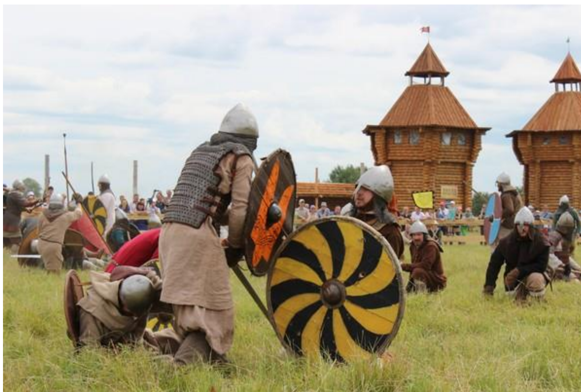
Рис. 11. Фестиваль живой истории «Волжский путь» в Ульяновской области

2. Фестиваль живой истории «Волжский путь» в Ульяновской области (рис. 11). Фестиваль живой истории «Волжский путь» посвящен воссозданию истории и культуры народов Восточной Европы IX–XIII вв. с упором на события в формате «живой истории», реконструкцию производственных и бытовых процессов, организацию взаимодействия ученых (археологов и экспериментаторов) с любителями исторической реконструкции.