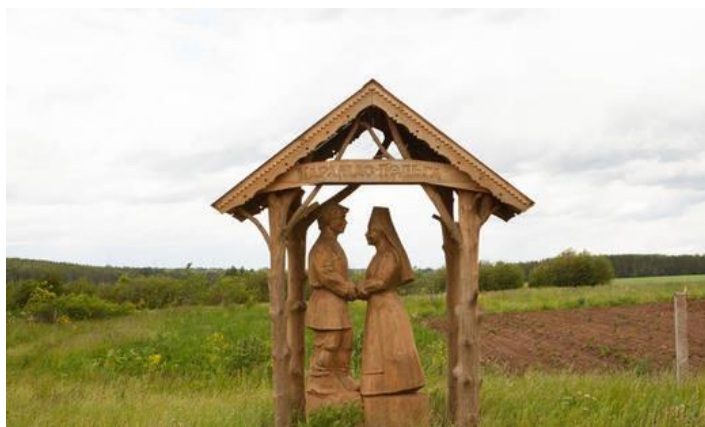
Рис. 24. Скульптура Карамаса и Пельги