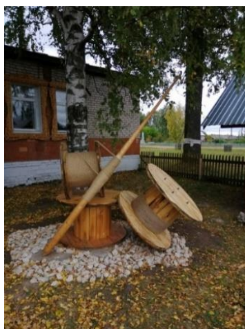
Рис. 37. «Традиции живая нить». Культурный квартал с. Булай

Арт-объект «Традиции живая нить» представляет собой композицию, созданную в виде огромных катушек с пряжей и нитями на веретене (рис. 37). Веретено означает «Нечто вращающееся», и представляет собой деревянную точеную палочку, оттянутую в острие к верхнему концу и утолщенную к нижней трети, это основа для наматывания будущей нити при прядении. Название этого объекта говорит само за себя: как нить вертится на веретене, так и в жизни все меняется: движется, крутится, умирает и возрождается. Веретено всегда связывалось со временем и непрерывным течением жизни.