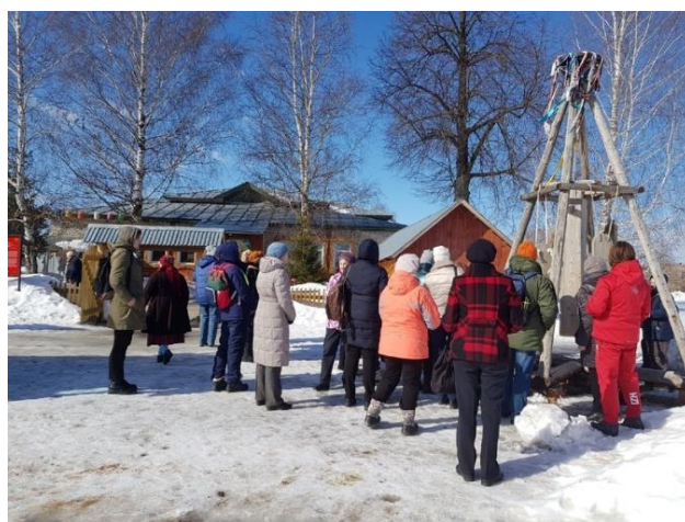
Рис. 35. Тангыра «Чум». Культурный квартал с. Булай

Эта тангыра сделана в виде чума, она оповещает жителей села о приезде дорогих гостей (рис. 35). Автором и вдохновителем этой работы является татарский художник Ленар Ахметов.