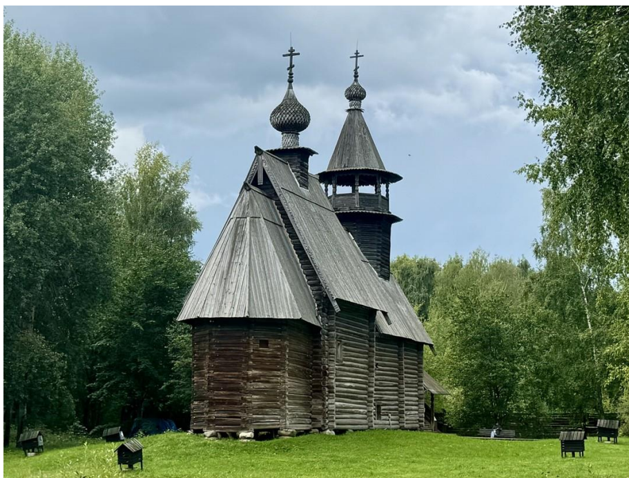
Рис. 4. Костромской архитектурно-этнографический и ландшафтный музей-заповедник «Костромская слобода»

Рассмотрим подробнее Костромской архитектурно-этнографический и ландшафтный музей-заповедник «Костромская слобода», который представляет музей деревянного зодчества под открытым небом (рис. 4). Музей размещен на территории г. Костромы у стен древнего Свято-Троицкого Ипатьевского монастыря. Экспозиции музея, размещенные в деревянных храмах и избах, рассказывают об особенностях материальной культуры, крестьянского быта Костромского края XVIII–XIX вв.