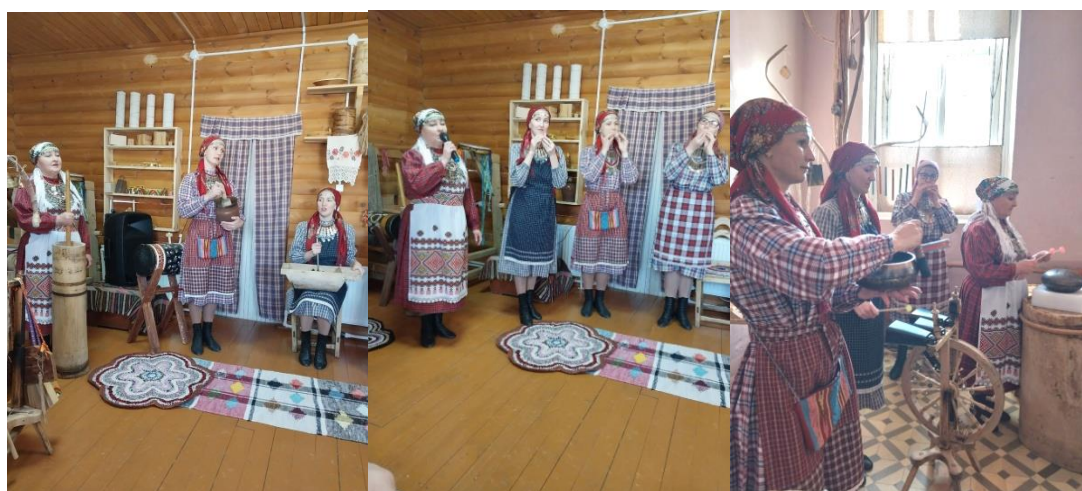
Рис. 39. Центр удмуртской культуры с. Булай

Центр удмуртской культуры в с. Булай интересен еще и тем, что здесь можно познакомиться с традиционными музыкальными инструментами и музыкальными традициями. Участники творческого коллектива очень увлекательно рассказывают об истории появления некоторых удмуртских инструментов, об их эволюции, о разновидностях инструментов, знакомят с современными инструментами и т. д. (рис. 39). Гости Центра могут не только послушать звучание инструментов, но и сами взять их в руки и что-нибудь исполнить.