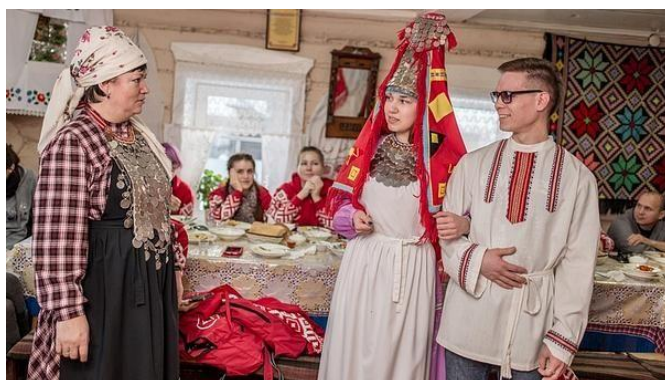
Рис. 27. Центр удмуртской культуры в дер. Карамас-Пельга

Но если вернуться к этнической составляющей, то здесь можно познакомиться с удмуртским пониманием жизненного цикла в виде трех свадеб (рис. 27).