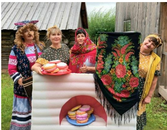
Рис. 33. Центр удмуртской культуры в дер.Сундур. Дом Лопшо Педуны

Отличительной особенностью центра является то, что все в нем живое: от Лопшо Педуны, героя удмуртских сказок, до окружающих музейных предметов. Можно не просто посмотреть на экспонаты, а окунуться в атмосферу удмуртского гостеприимства, удивиться работе мастера и смекалке народа, сделать что-то подобное под наставничеством мастеров и Лопшо Педуны (рис. 33).