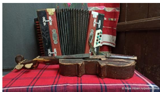
Рис. 47. Экспонаты музея

В Кестыме уже давно действует туристический маршрут. Еще в середине 1990-х годов местные энтузиасты взялись за развитие деревни и привлечение в нее гостей. Что же показывают туристам удмуртские татары в Кестыме?