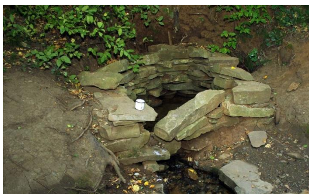
Рис. 23. Родник с «живой» водой

Среди природных объектов местом активного посещения являются родники , которые еще прежде располагались на данной территории, но сейчас органично включены в музейный комплекс и являются ключевым местом музейных экскурсий и мероприятий (календарные праздники, свадьбы). Родники имеют разный состав воды, поэтому их называют «мертвый» и «живой». У живого ключа стоит чашка – с ее помощью можно напиться воды (рис. 23).