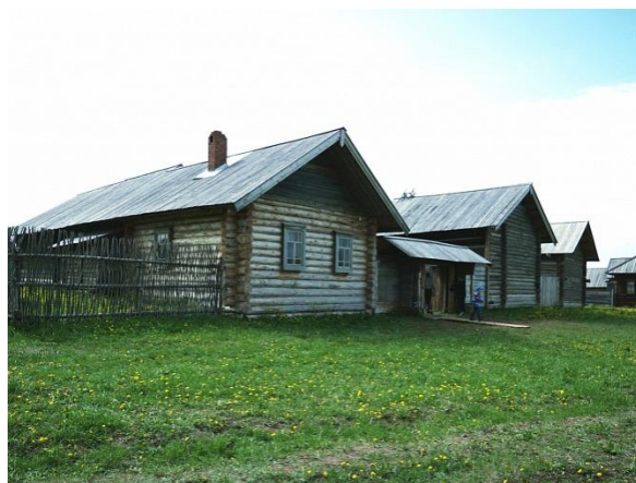
Рис. 19. Усадьба бесермян

Бесермянская усадьба представляет жилищно-хозяйственный комплекс, материальную и духовную культуру бесермян – коренного малочисленного народа России, компактно, проживающего лишь на северо-западе Удмуртии в бассейне Чепцы (левого притока Вятки) (рис. 19).