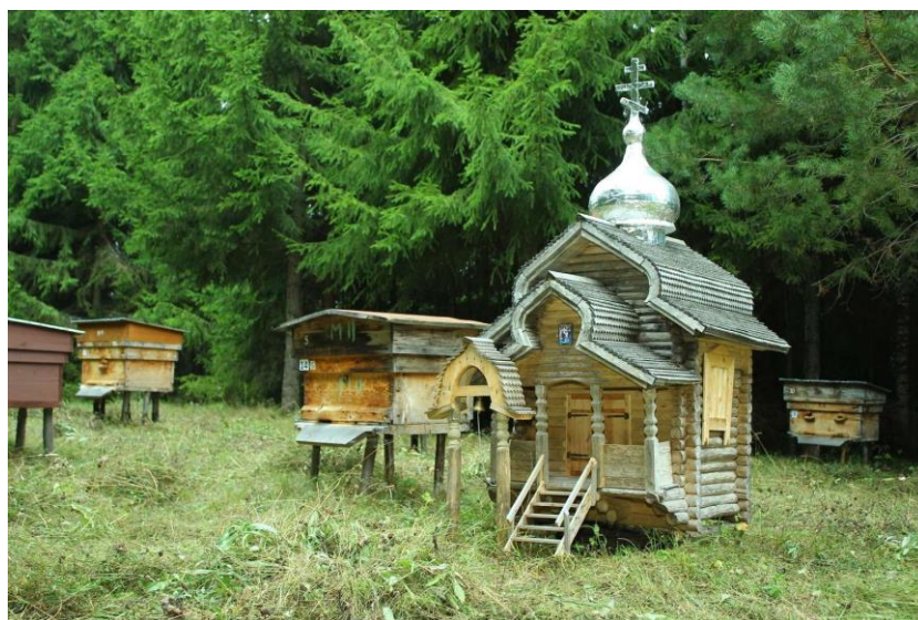
Рис. 13. Пасека в Лудорвае

Помимо усадебных комплексов экспозиционное и ландшафтное пространство включает ветряную мельницу «Вуко», священную рощу «Луд», пасечный комплекс «Муш бакча», родники. Территория музея – это единое экспозиционно-ландшафтное пространство. Здесь органично представлены и почитаемые объекты как, например, священная роща «Луд» – место моления удмуртов, и объекты хозяйственной деятельности, и действующие экспозиции, и хозяйственный комплекс музея. На небольшой опушке в черте музея располагается пасечный комплекс – Муш бакча (рис. 13). Он включает омшаник – помещение для зимовки пчел, домик пасечника с инструментами и предметами бортничества и пчеловодства, коллекцию рамных ульев, гостевую беседку. Пасека является действующим объектом. Ежегодно в день Медового Спаса на дегустацию «лудорвайского» меда, собранного на пасеке музея-заповедника, приезжают жители и гости со всех уголков Удмуртии.