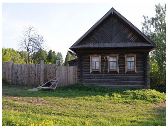
Рис. 17. Усадьба В.А.Щепина

После смерти бабушки усадьбу использовали в качестве дачи, здесь держали огород и пчел. Жилой одноэтажный дом представляет собой пятистенок на подклете, построенный, предположительно, в середине XX в. (рис. 17).