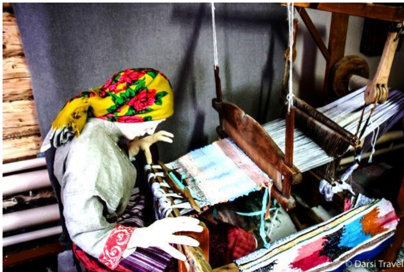
Рис. 30. Центр удмуртской культуры в дер. Сундур. Дом Лопшо Педуня (ткацкий станок в женском зале)