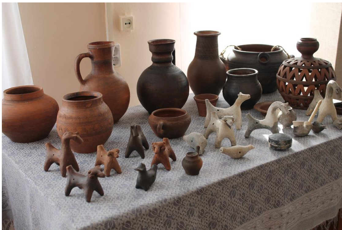
Рис. 12. Юрьевский гончарный промысел

Рассмотрим в качестве примера гончарный промысел «Юрьевская керамика» (рис. 12).