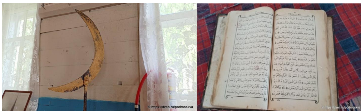
Рис. 46. Экспонаты выставки

Также в исторической кестымской мечети развернута выставка исламской культуры, где среди экспонатов можно увидеть: полумесяц с макушки мечети 1905 года, фрагменты колонн исторического минарета, казанские издания Корана конца XIX – начала XX веков (рис. 46).