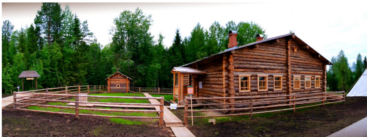
Рис. 3. Финно-угорский этнокультурный парк (Этнопарк)

Рассмотрим подробнее Финно-угорский этнокультурный парк (Этнопарк), который представляет собой многофункциональный туристский комплекс (ядро туристского кластера), отличительной особенностью которого является широкое практическое использование этнического компонента – культурного наследия родственных финно-угорских и самодийских народов в туристских продуктах и услугах парка (рис. 3).