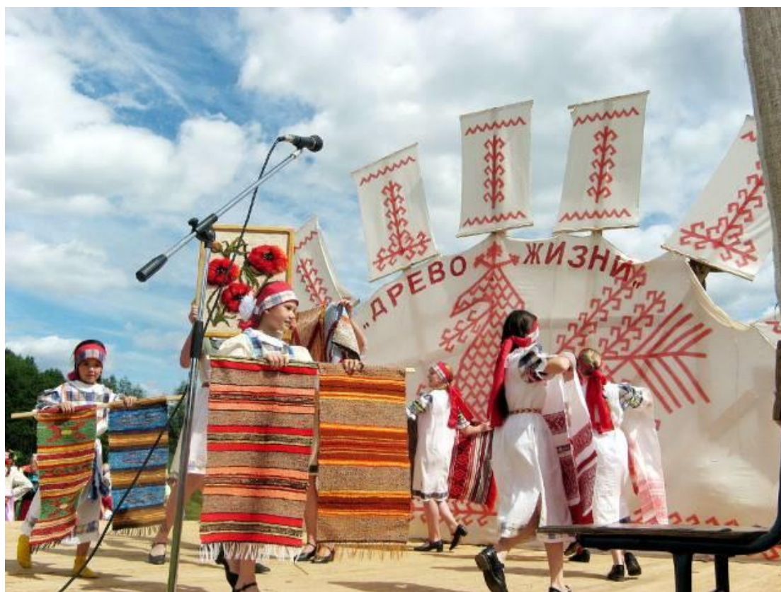
Рис. 10. Областной вепский праздник «Древо жизни»

История праздника начинается с 1987 г., когда мероприятие состоялось впервые. Символикой праздника является Древо жизни – космическое Мировое древо, в традиционном сознании связанное с религиозно-мифологической моделью мира. В контексте праздника «Древо жизни» рассматривается как основа вепской культуры, способ передачи национальных традиций от поколения к поколению. Праздник направлен на возрождение вепских национальных традиций, сохранение вепского языка.