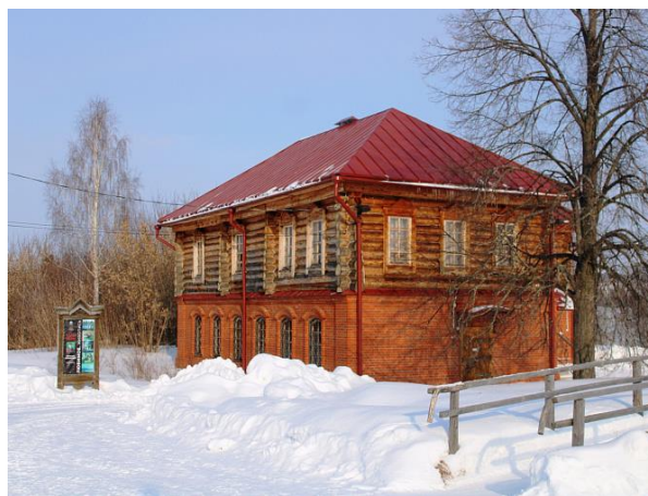
Рис. 18. Здание волостного правления

Волостное правление – символ светской власти в населенном пункте, пришедшем на смену общинному крестьянскому самоуправлению. Волостные правления были учреждены «Общим положением о крестьянах, вышедших из крепостной зависимости» от 19 февраля 1861 года как исполнительный орган крестьянского сословного самоуправления. Они состояли из волостного старшины, всех сельских старост волости и волостного писаря.