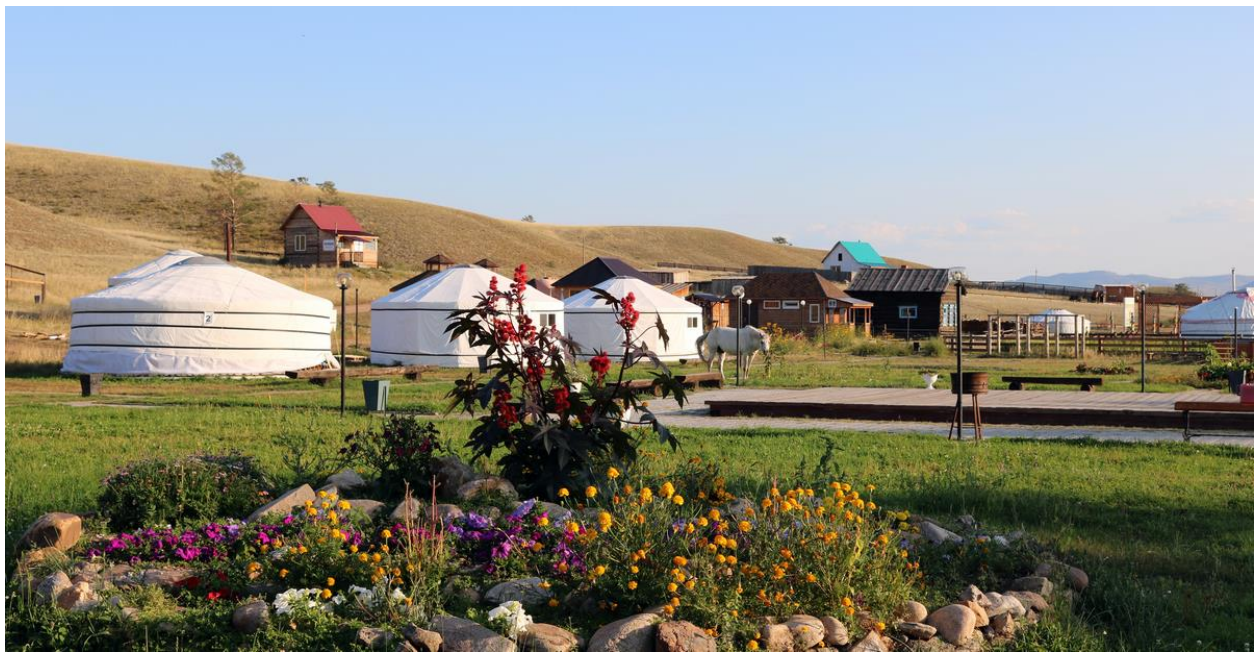
Рис. 6. Этнокомплекс «Степной кочевник» в Республике Бурятия

Туристская поездка в «Степной кочевник» включает посещение Ацагатского буддийского монастыря, одного из старейших храмов Бурятии, основанного в 1825 г. В 1891 г. храм посетил цесаревич Николай в рамках кругосветного путешествия. Объектом посещения является Дом-музей Агвана Доржиева, известного буддийского ученого, политического и религиозного деятеля, учителя Далай-ламы XIV.