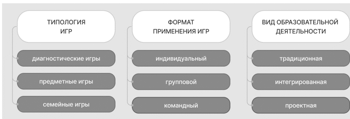
Рис. 1. Классификация тьюторских игр

иметь различные форматы от индивидуального до командного и быть реализована в различных видах образовательной деятельности, как в традиционной форме, так и в проектной (рисунок 1).