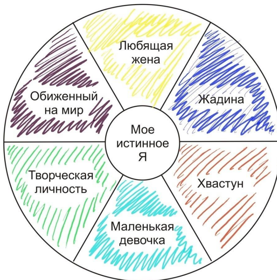
Рис. 2. Круг субличностей