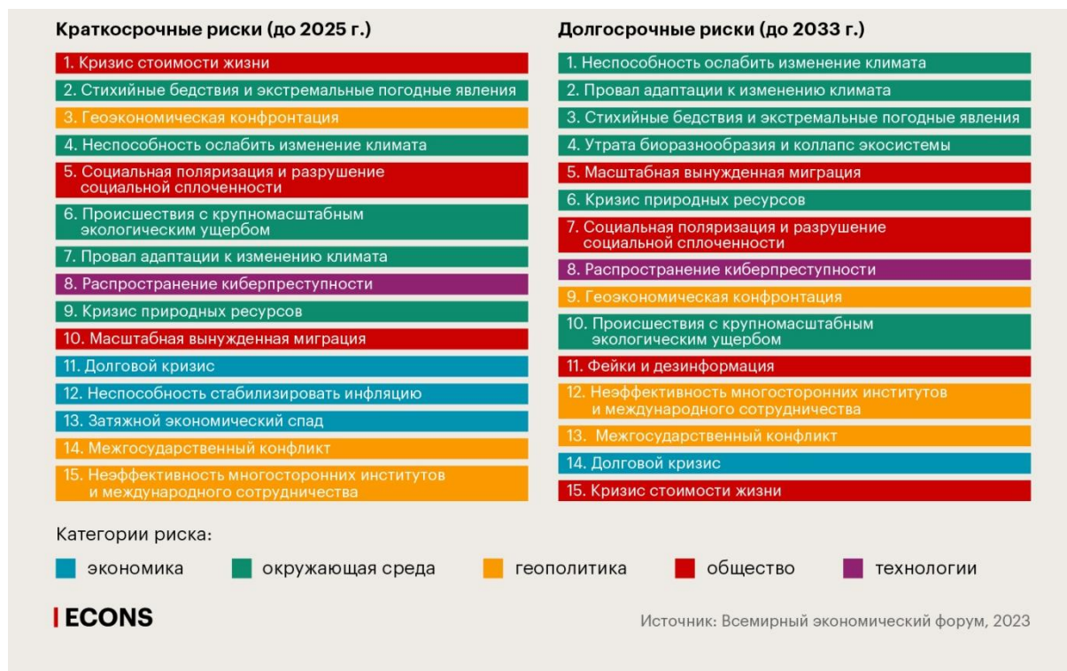
Рис. 3. Топ-15 глобальных рисков на горизонте двух и десяти лет

Фактически рост интереса к экологической безопасности в последние годы является отражением глобальных тенденций и перемен в общественном мнении. Топ-15 глобальных рисков на горизонте двух и десяти лет обозначенных Всемирным экономическим форумом в 2023 году представлены на рисунке 3.