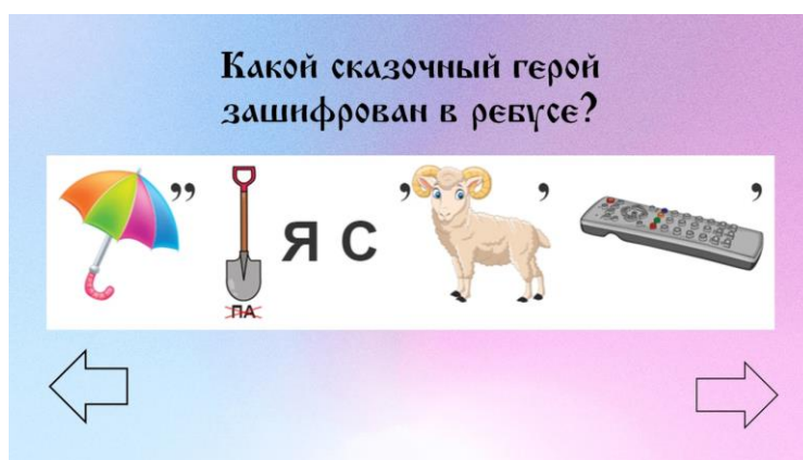
Рис. 4. Слайд вопроса: категория «Отгадай-ка», цена 40