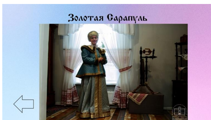
Рис. 5. Слайд с ответом на вопрос: категория «Отгадай-ка», цена 40

Данная работа расширяет кругозор школьников, улучшает запоминание краеведческого материала с помощью ярких визуальных образов и личного участия каждого экскурсанта в интерактиве. Изначально «Путешествие по сказкам Удмуртии» задумывалась как игра-викторина, предвещающая экскурсию, которая будет использоваться в детском музейном центре Дача Моцевитина в Сарапуле. Однако, она может использоваться не только как интерактивный элемент в ходе музейной краеведческой экскурсии, но и быть самостоятельной краеведческой экскурсией, доступной в электронном варианте через Интернет. В настоящее время игры, разработанные студентами, активно используются в Сарапульских музеях в процессе школьных экскурсий.