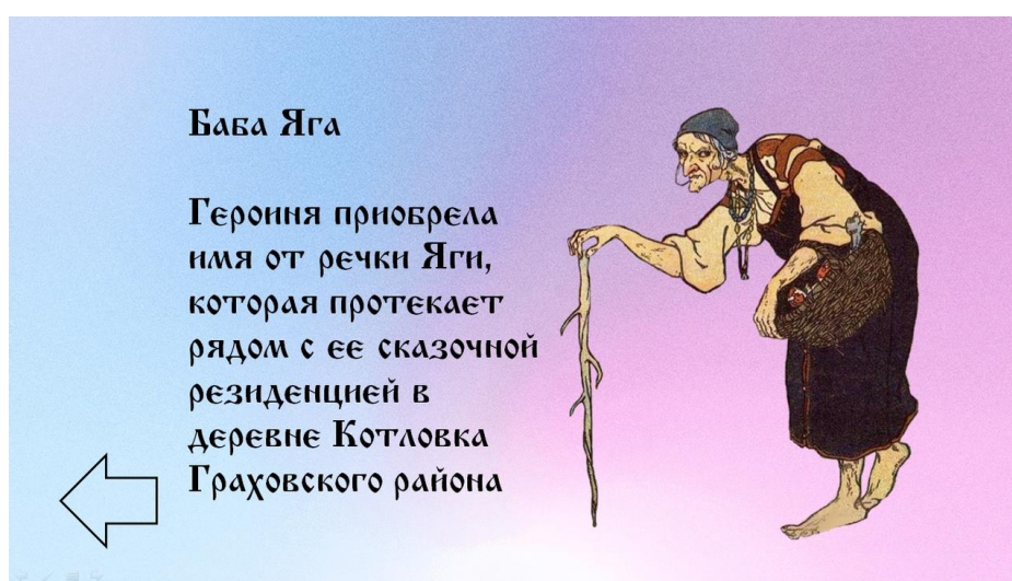
Рис. 3. Слайд с ответом на вопрос: категория «Герои», цена 10