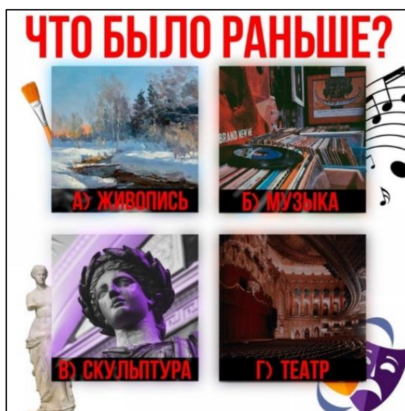
Рис. 5. Пост с загадкой о первом появившемся виде искусства

Рубрика «Интерактив» носит функционал вовлечения, способствует укреплению связей с аудиторией и стимулирует активное участие подписчиков. Данная рубрика включает интерактивные формы работы с аудиторией — опросы, викторины, квесты и т.д. К примеру, пост от 8 февраля 2026 г.: «Как вы думаете, что появилось раньше? Человек сначала пел, рисовал, высекал формы или разыгрывал истории?...».