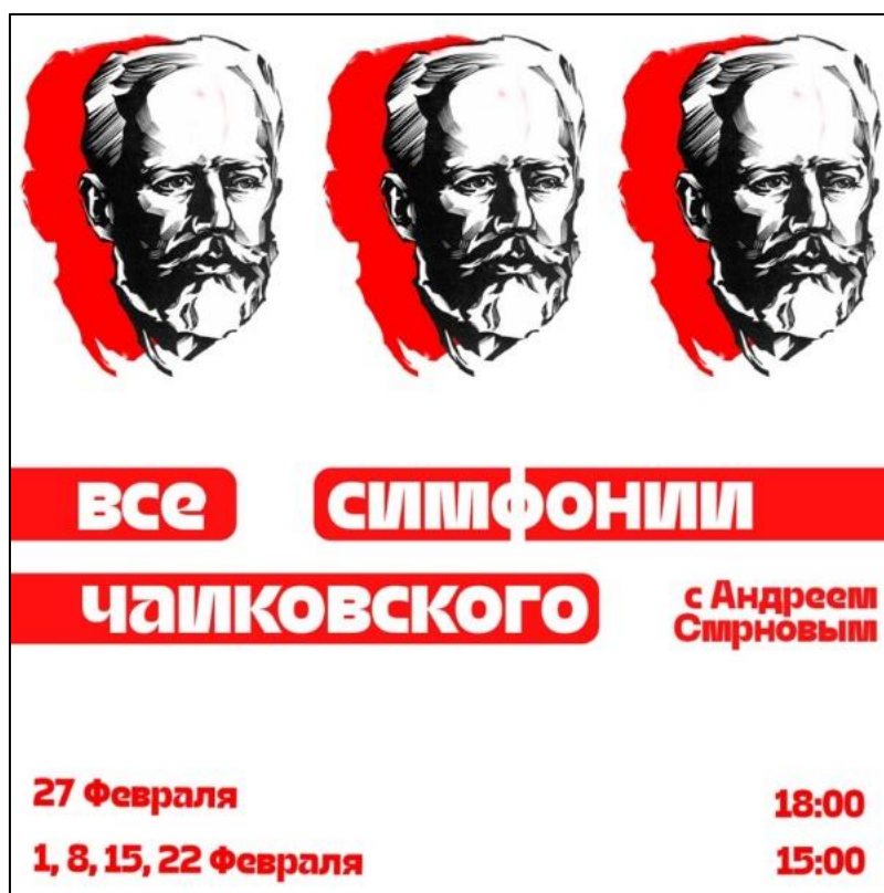
Рис. 1. Афиша серии мероприятий, связанных с прослушиванием симфоний П.И. Чайковского

Рубрика «Афиша Арт-центра» информирует о предстоящих мероприятиях, лекциях, выставках и мастер-классах, обеспечивая оперативное привлечение аудитории. Например, пост от 17 февраля 2026 г., посвященный циклу музыкальных встреч Андреем Смирновым - куратором Ижевского киноклуба и страстный любитель музыки (рис. 1). Встречи проходили каждое воскресенье в Национальной библиотеке Удмуртской Республики. Перед встречей ведущий рассказывал о прослушиваемом произведении П.И. Чайковского.