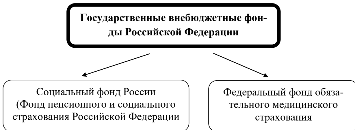
Рис.1. Государственные внебюджетные фонды РФ

В Российской Федерации созданы и функционируют два государственных внебюджетных фонда (в социальной сфере) (рис. 1):