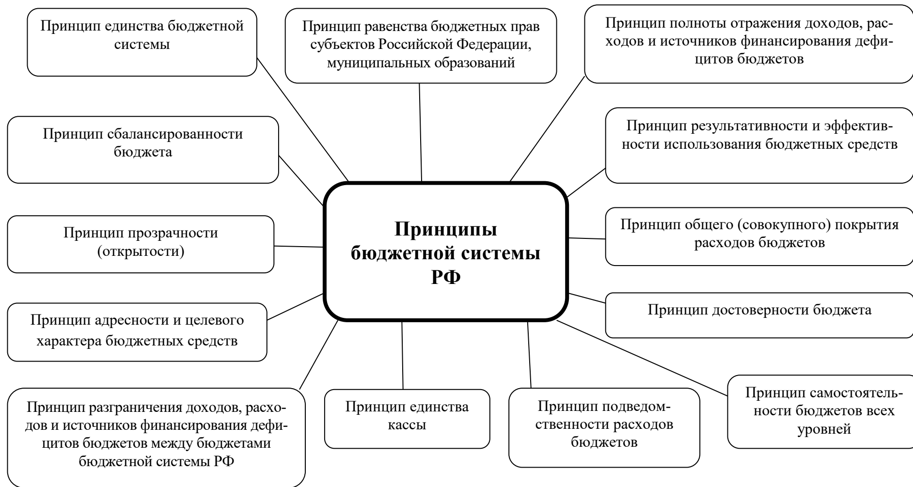
Рис. 3. Принципы бюджетной системы Российской Федерации