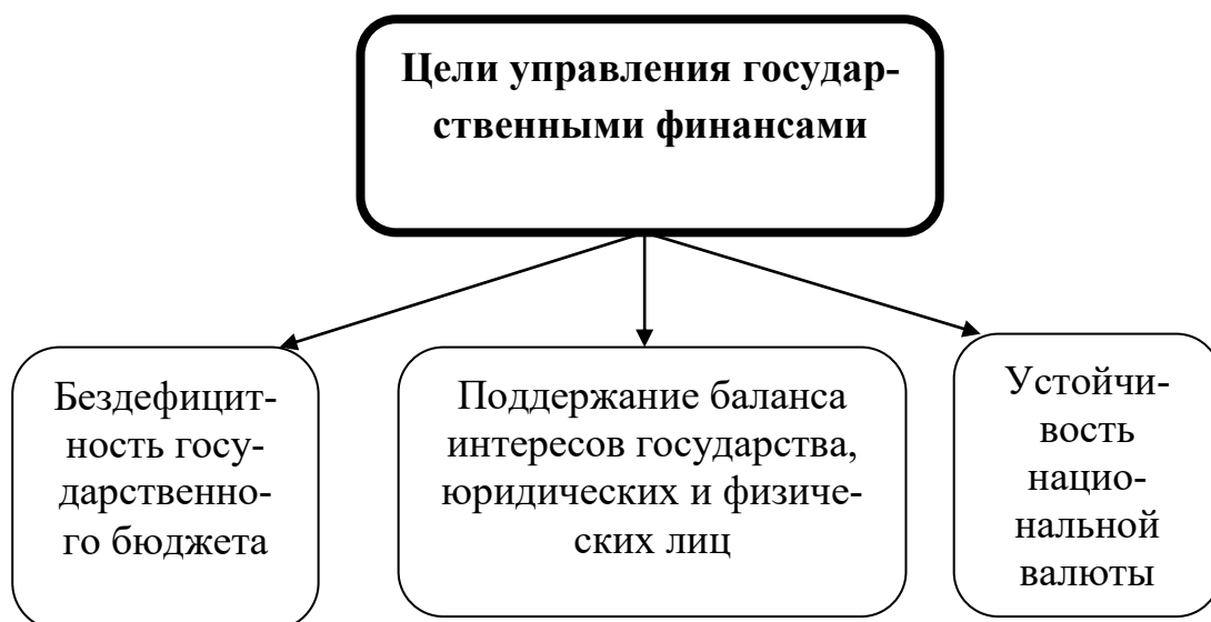
Рис. 2. Цели управления государственными финансами

Федеральные органы государственной власти, осуществляющие финансовую деятельность: