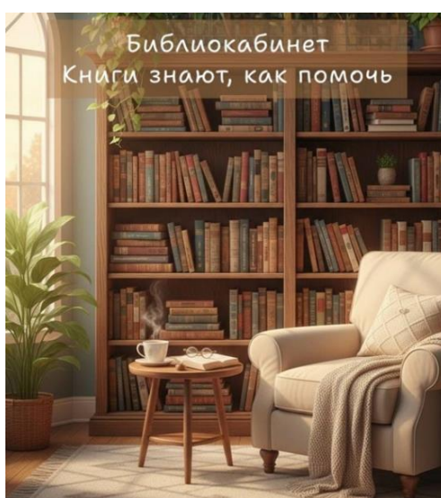
Рис. 1. Заставка проекта «#Библиокабинет»

Цель нашего проекта «#Библиокабинет» – создать в сообществе точку притяжения для студентов, интересующихся чтением и саморефлексией, а также превратить чтение в осознанный инструмент работы над собой. Литература, в данном случае, выступила инструментом объяснения сложных эмоций, с которыми может столкнуться каждый студент: тревога перед будущим, страх «обычной жизни» и упущенных возможностей, ощущение собственной незначительности или, наоборот, потребность быть во всем идеальным и успешным. Каждый пост – разбор конкретного литературного произведения с примерами решений проблемы через действия героев. Эти ситуации могут перекликаться у студентов со своими жизненными ситуациями.